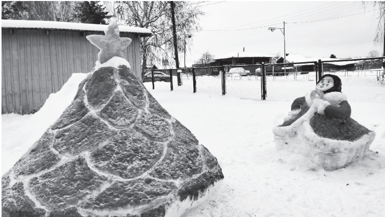
Снежные фигуры радуют и детей, и взрослых