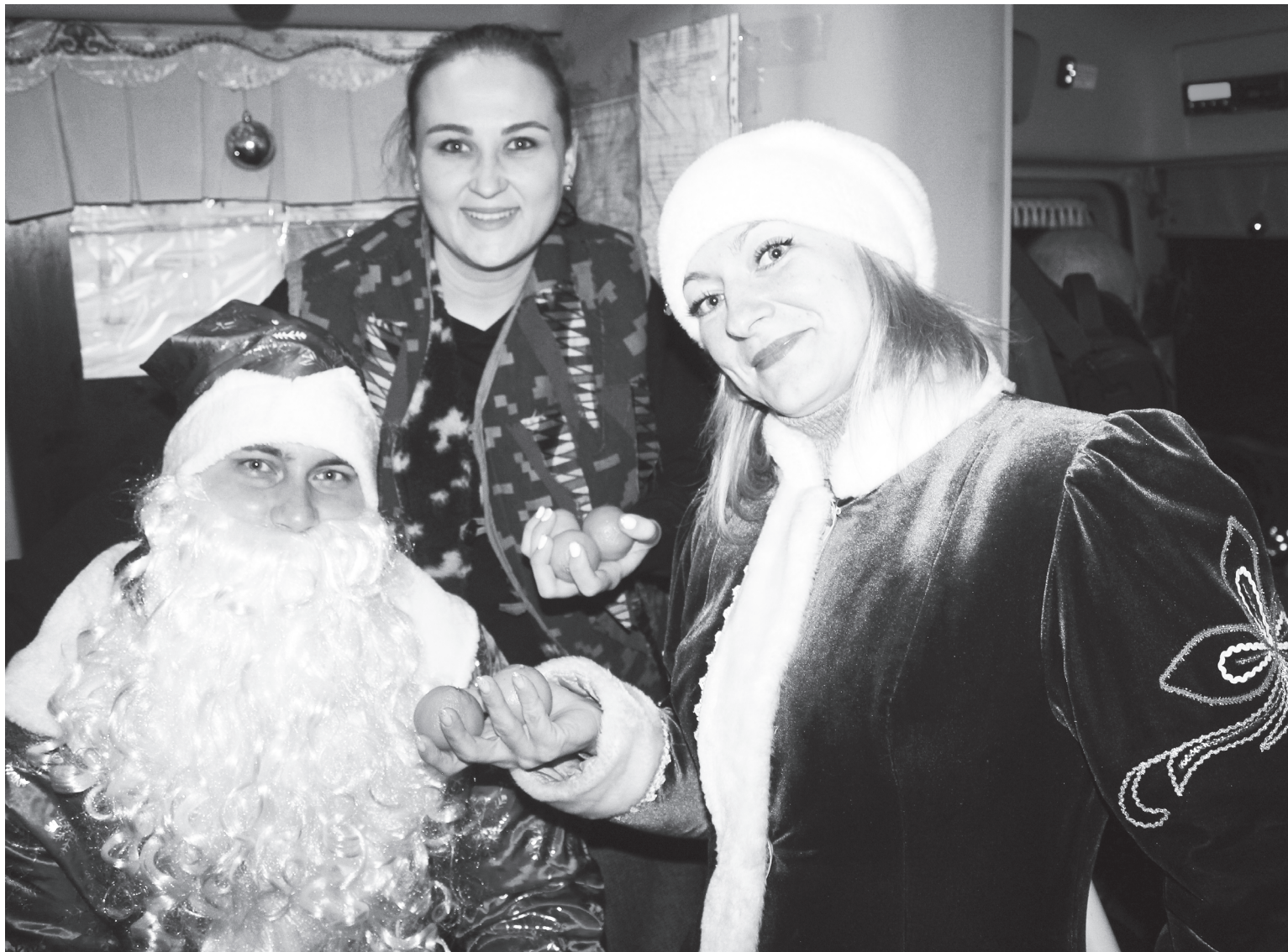
Какой же праздник без мандаринов!

«ДОБРЫЙ МАРШРУТ» – ЭТО УЛЫБКИ И ХОРОШЕЕ НАСТРОЕНИЕ