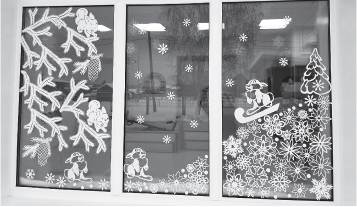
Сказочные сюжеты украшают окна

Галина КОРОЛЬ