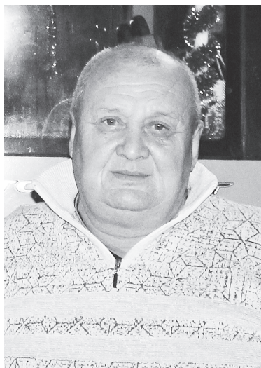
Даже для опытного водителя новогодний маршрут – особенный