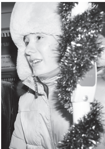
Вспомнить стихотворение – легко