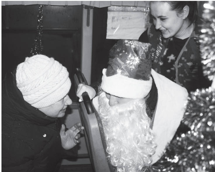
Дедушка Мороз обязательно исполнит заветное желание

Что необходимо, чтобы год был по-доброму прожит? Начать его с улыбкой! А специалисты Центра «Лидер» обязательно добавят: подарить хорошее настроение тем, кто рядом с тобой.