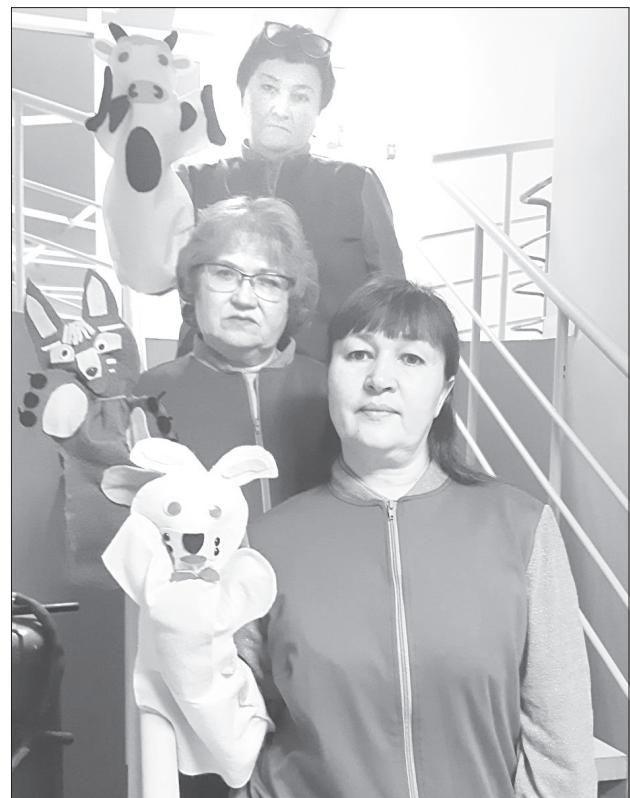
Всех кукол участницы театра стараются делать яркими и красивыми

- Не отказываются даже взрослые. Более того, один из участников форума «Серебряные волонтеры», который про-