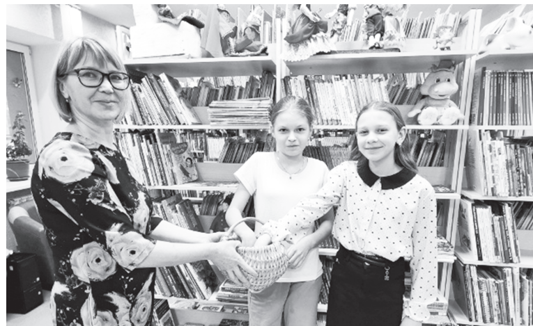
Лотерею для самых активных читателей провели в Детской библиотеке

Мария ЗОЛОТАРЕВА