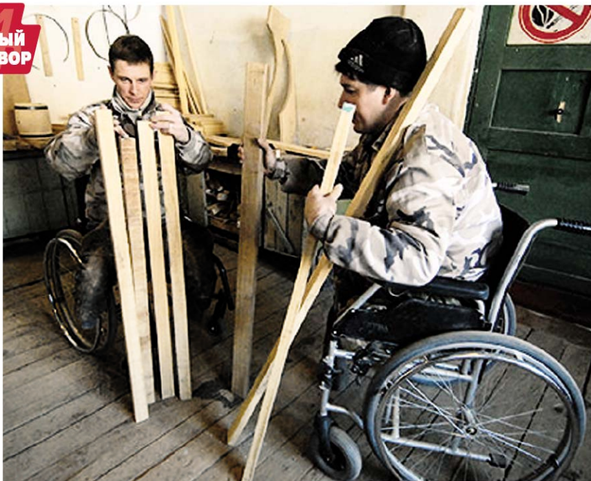
Инвалиды готовы браться за любую работу, а вот брать их готовы не все.

■ 1,3 тыс. рабочих мест для трудоустройства инвалидов имеется сейчас