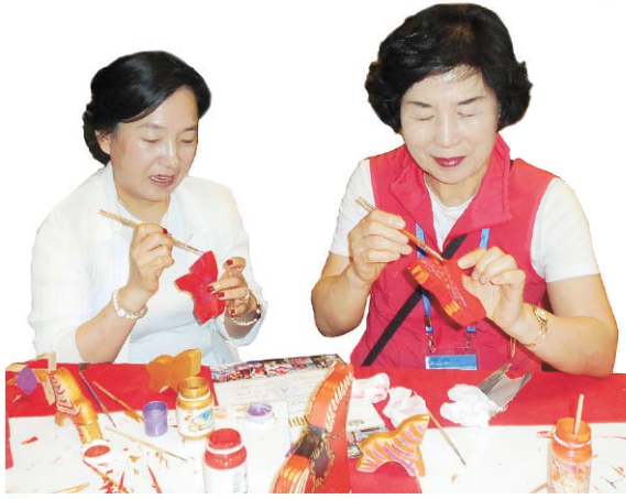
Мастер-класс от сибиряков приняли на ура.

Первый в регионе международный тур «Летопись Сибири в деревянной архитектуре города Тюмени» был представлен на английском и французском языках. В его основе - 14 уникальных памятников деревянного зодчества.