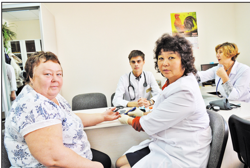
Проконсультироваться у медицинских работников по поводу своего здоровья мог любой желающий