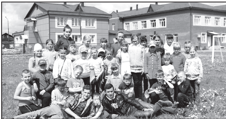
Отдыхом довольны на поляне школьной