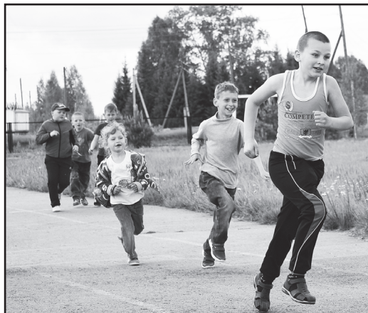
Прибавляем шаг: только свист в ушах