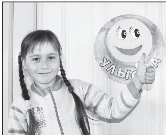
Утром проснись – солнцу улыбнись