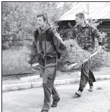
Добрые дела – чистота села