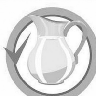
ПЕЙТЕ БОЛЬШЕ ЖИДКОСТИ