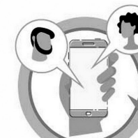
ИЗБЕГАЙТЕ КОНТАКТОВ С ЗАБОЛЕВШИМИ