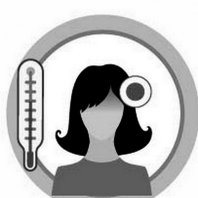
РЕЗКИЙ ПОДЪЕМ ТЕМПЕРАТУРЫ ТЕЛА И ОЗНОБ