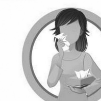
ИСПОЛЬЗУЙТЕ ОДНОРАЗОВЫЕ САЛФЕТКИ ПРИ КАШЛЕ И ЧИХАНИИ