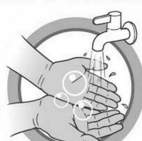
РЕГУЛЯРНО МОЙТЕ РУКИ