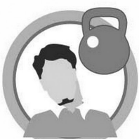
ОБЩЕЕ НЕДОМОГАНИЕ, СЛАБОСТЬ