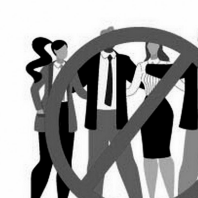
ОГРАНИЧЬТЕ ПРЕБЫВАНИЕ В МЕСТАХ СКОПЛЕНИЯ ЛЮДЕЙ