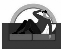
СОБЛЮДАЙТЕ ПОСТЕЛЬНЫЙ РЕЖИМ