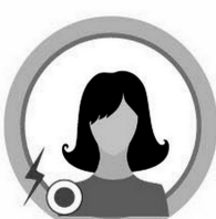
ЛОМОТА В МЫШЦАХ И СУСТАВАХ