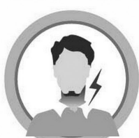
БОЛЬ, ПЕРШЕНИЕ В ГОРЛЕ