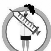
СДЕЛАЙТЕ ПРИВКУ ОТ ГРИППА