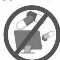
НЕ ЗАНИМАЙТЕСЬ САМОЛЕЧЕНИЕМ