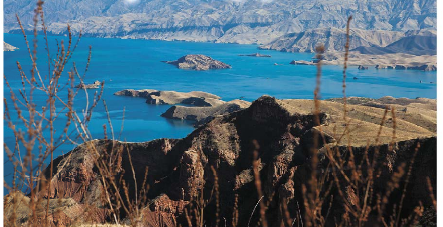
От местных красот просто дух захватывает.

- Откуда-то взялось мнение, что русские - сумасшедшие, непредсказуемые, готовы на всякие безумные приключения (смеется). Но я в корне с этим не согласен. Все самые сумасшедшие события организуют европейцы. У них вообще другой подход к жизни. Например, как отдыхает среднестатистический русский? Берет с собой семью, едет на море, лежит на пляже, ест и спит. У европейцев по-другому - им нужно еще до 30 лет посмотреть мир, «загрузиться впечатлениями». Для русских славиться на рафтах по Катуну - уже достаточно, чтобы считать себя