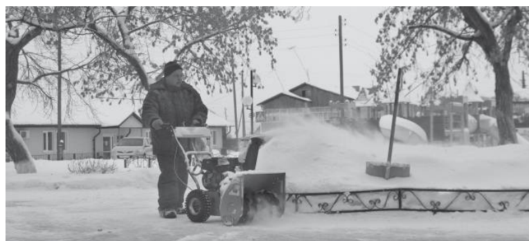
* Этой зимой работы хватает.