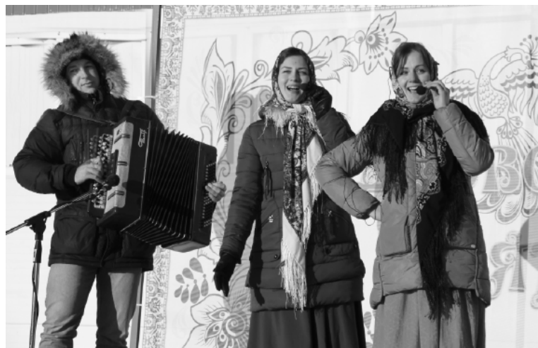
* Сельскохозяйственная ярмарка «Дары земли Сладковской» собрала на рыночную площадь много участников и гостей.