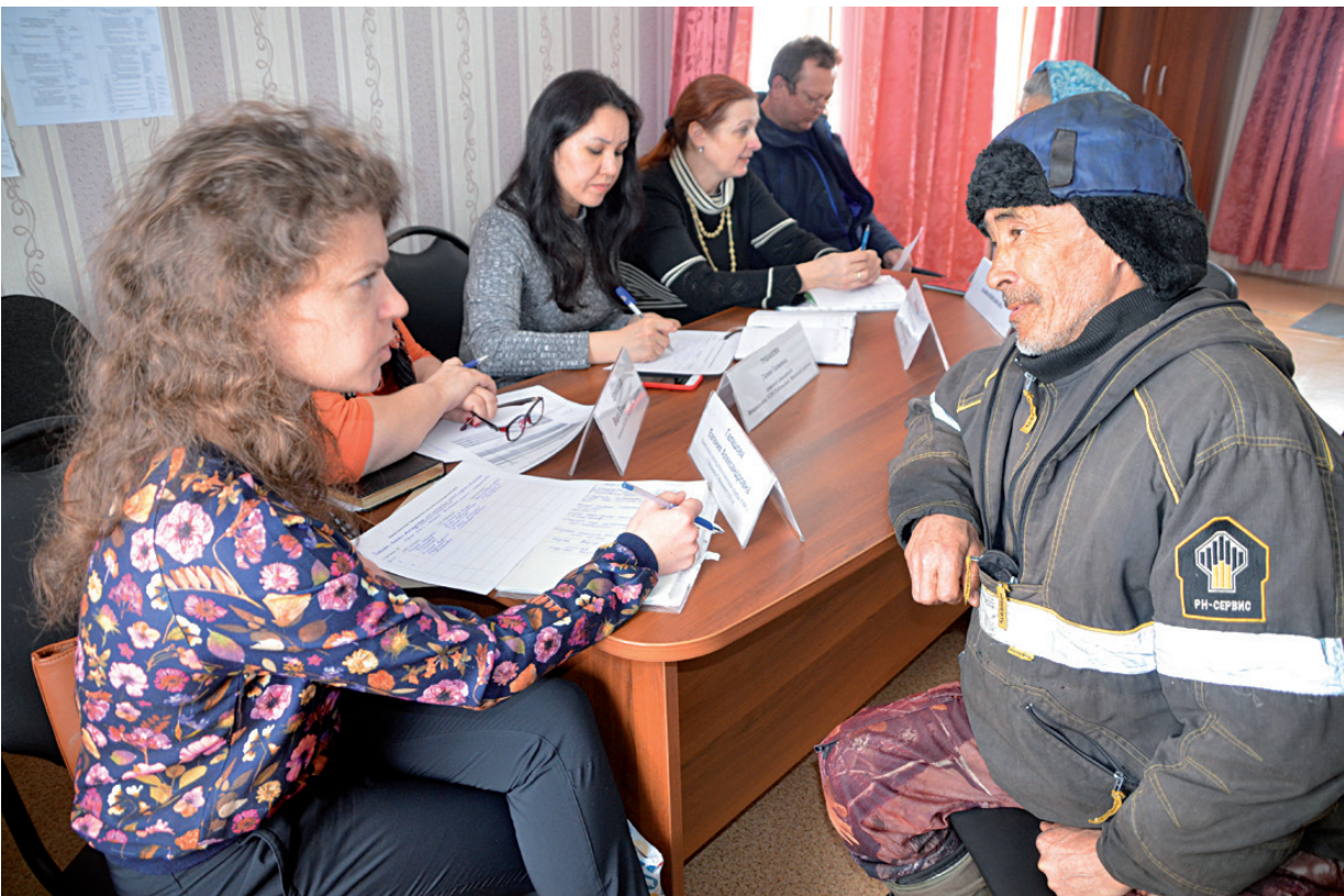
На встрече специалисты объяснили, какие документы нужно собрать для социальных выплат