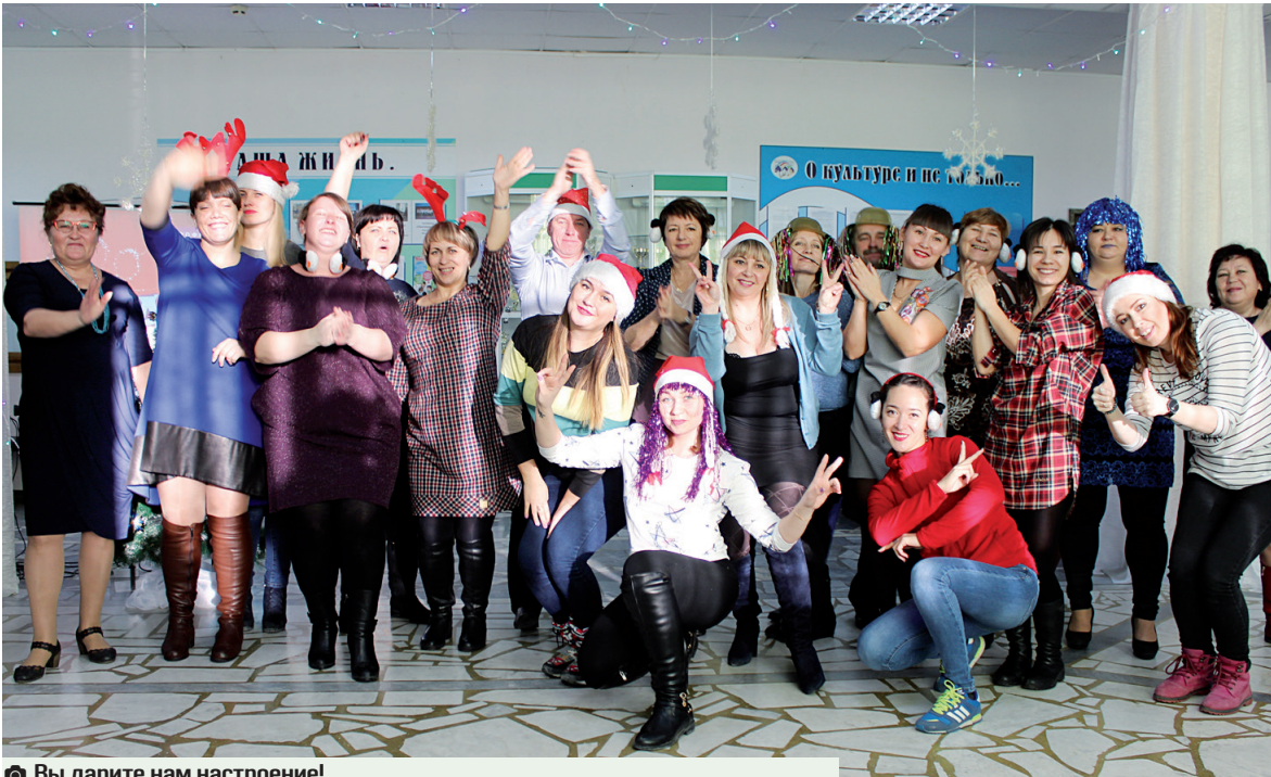
☎ Вы дарите нам настроение!

Плодотворными, насыщенными, творческими были последующие десятилетия. Несмотря на перенесённые многочисленные реорганизации, проблемные моменты, годы кризиса, сельская культура оставалась верной своему девизу, «несла культуру в массы».