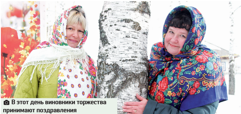
В этот день виновники торжества принимают поздравления