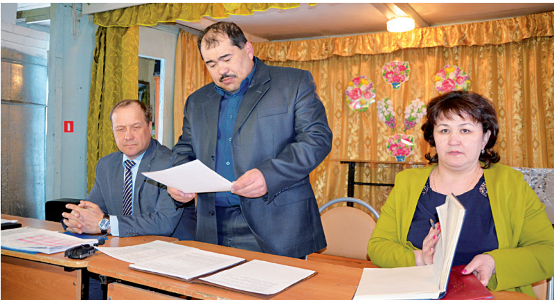
Глава Тобольского района Юрий Батт и глава Лайтамакского сельского поселения Марат Биктимиров рассказали о ходе дел в Заболотье

человек принял участие в месячнике санитарной очистки и благоустройства территории.