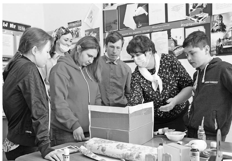
» «Юный дизайнер»