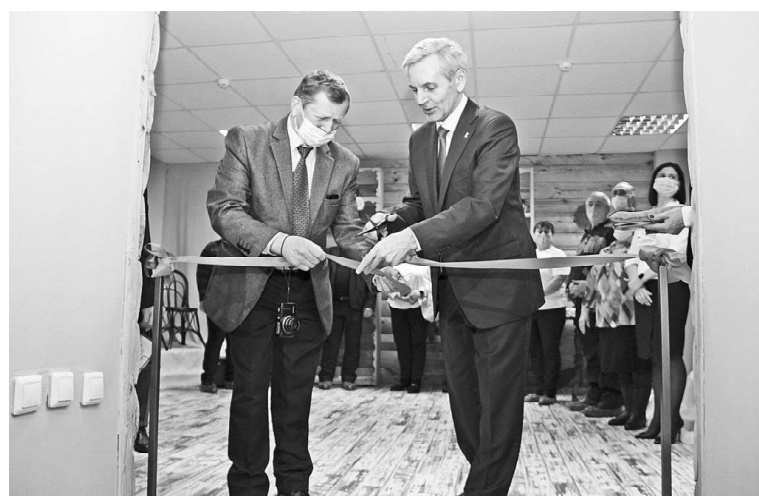
➤ Открытие Зала Правды о войне в музее