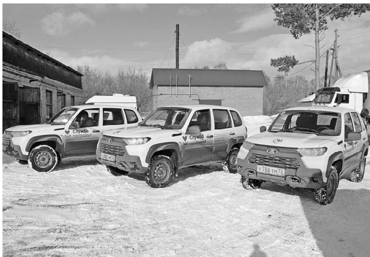
➤ Новые автомобили для больницы