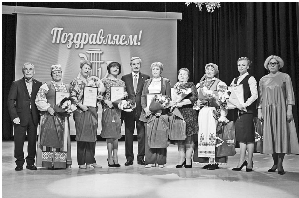
➤ Награждение специалистов в День работника культуры