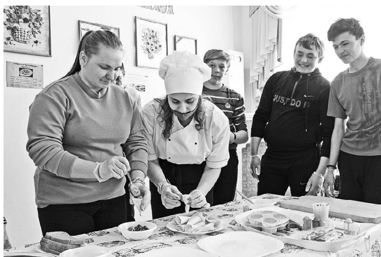
» «Арт – кухня»

здавали макет комнаты, подбирая для неё соответствующую мебель, обои, шторы. Таким образом, в ходе мероприятия каждый школьник попробовал себя в роли повара, кондитера, дизайнера.