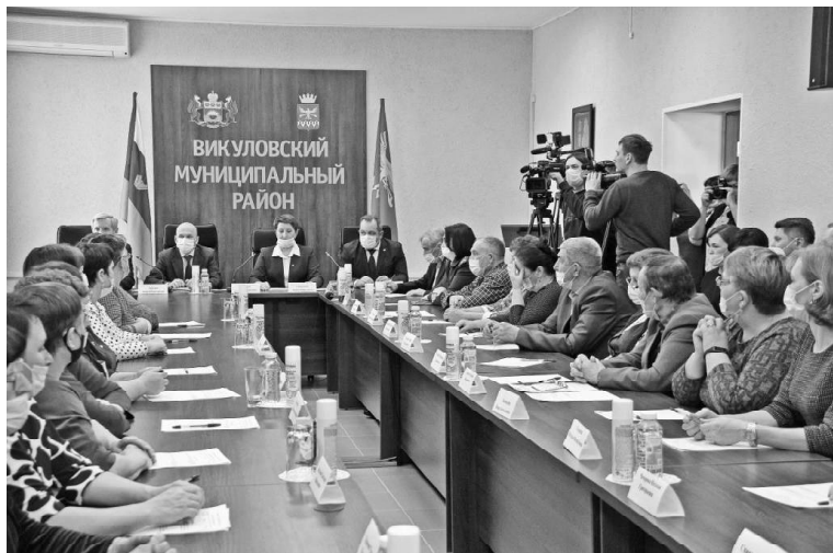
➤ Идёт заседание районной Думы