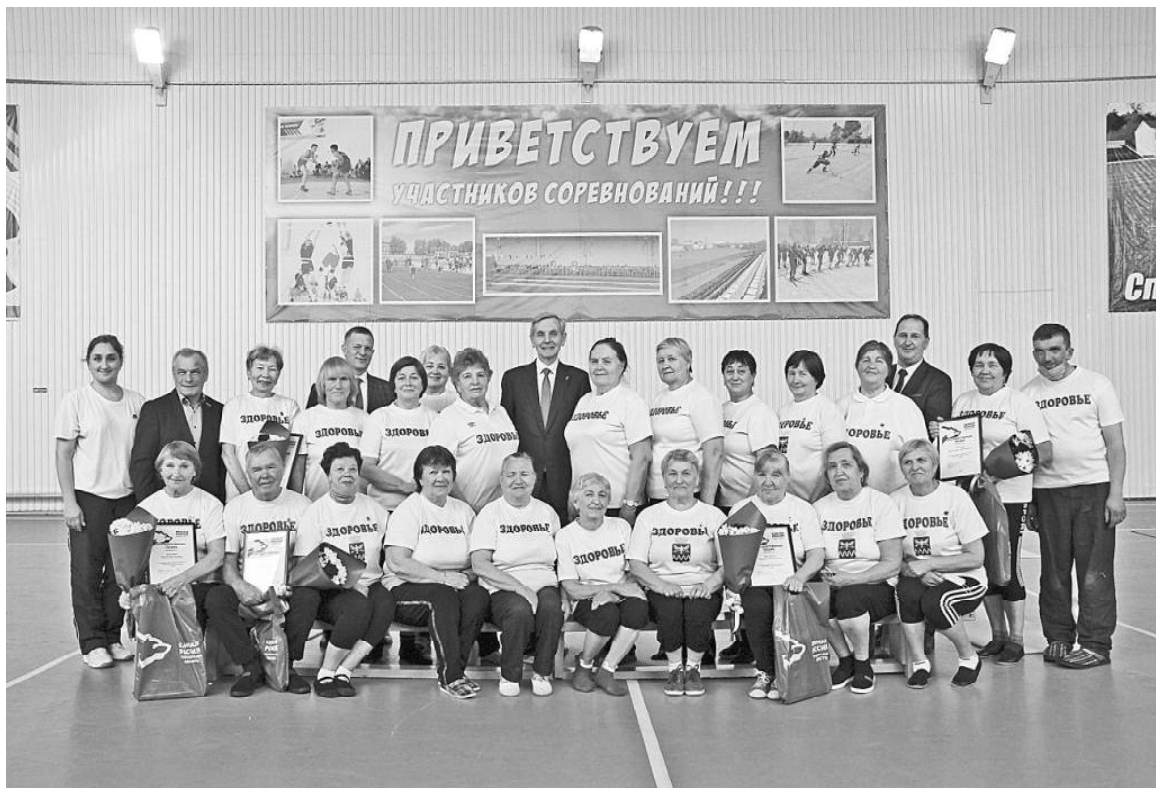
➤ Общее фото с членами группы «Здоровье»