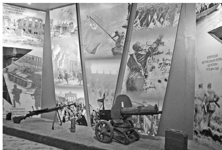
➤ Фото Татьяны СУХОВОЙ