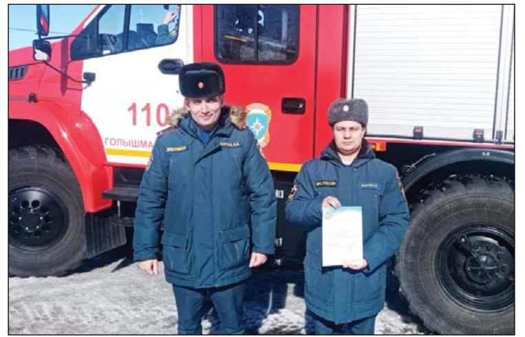
◆ Команда пожарно-спасательной части № 150 заняла третье место в соревнованиях. ► Фото из архива 150 ПСЧ.