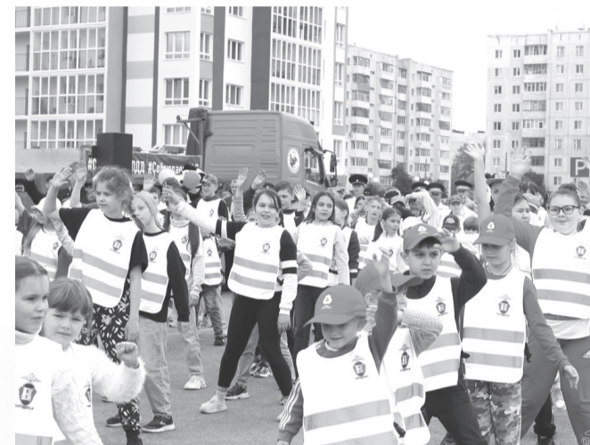
Юные инспекторы движения