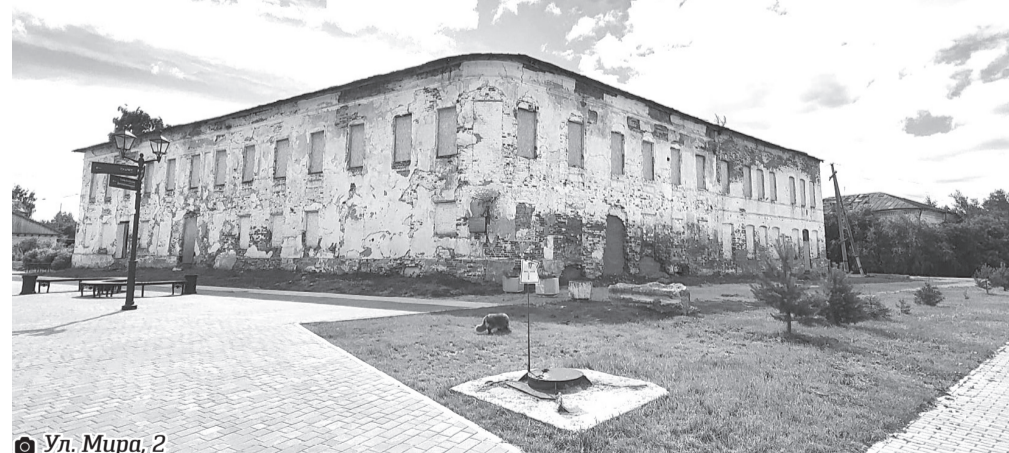
Ул. Мира, 2