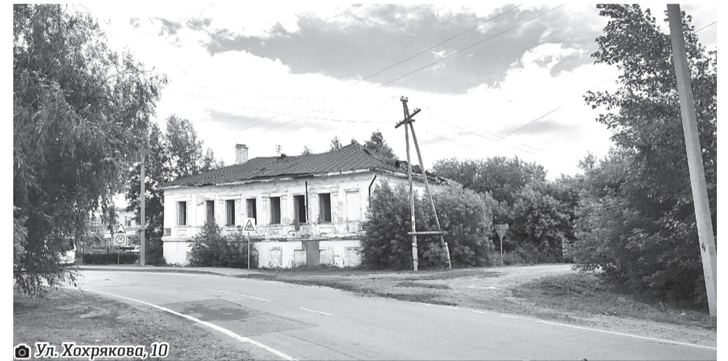
Ул. Хохрякова, 10

нии лазерного сканирования данного объекта культурного наследия и в доработке проектной документации на его консервацию. В результате в 2021 году в рамках муниципального контракта, заключённого с ООО НПО «СибСпецСтройРеставрация», было осуществлено допроектирование на консервацию. Её, по словам Натальи Мудриченко, планируется выполнить в 2023 году.