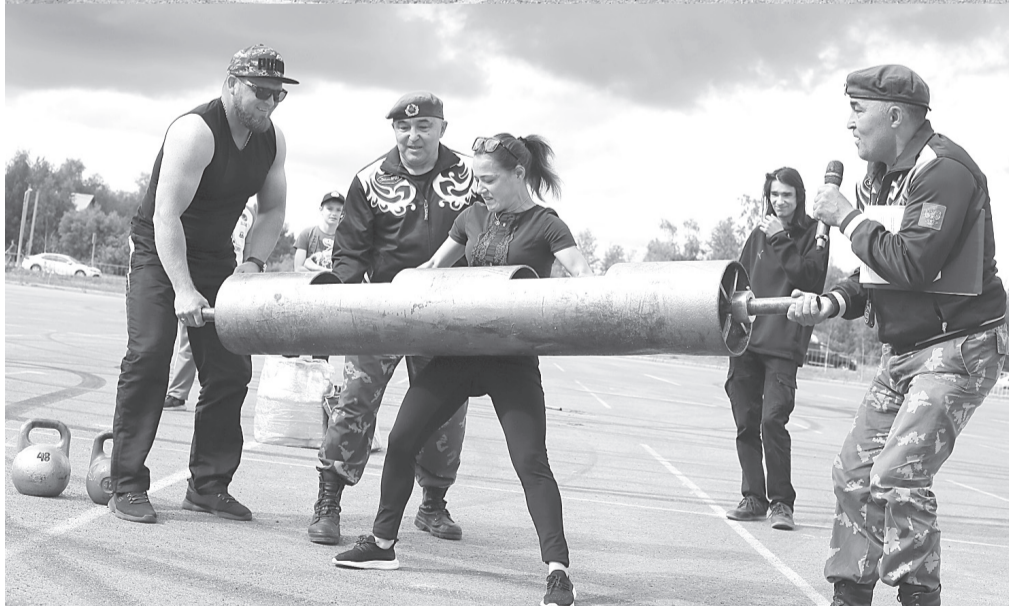
80 кг – для нас как разминка