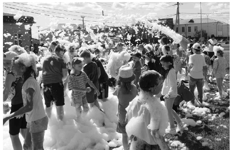
Как магнитом тянуло пенное шоу

выкли. Супы - рассольник, гороховый с гренками, борщ. Если в меню куриная лапша, чуть тарелки не облизывали. Картофельное пюре тоже сметалось без остатка. Хороши были и первое, и второе. Спасибо большое поварами! Конечно, дети едят не все, многие любят пиццу, бургеры, чипсы, но это вредная пища. Мы пропагандируем в лагере здоровый образ жизни. Наблюдала, если ребенку блюдо понравится, он его обязательно скушает. Кто-то не хотел есть котлеты или еще