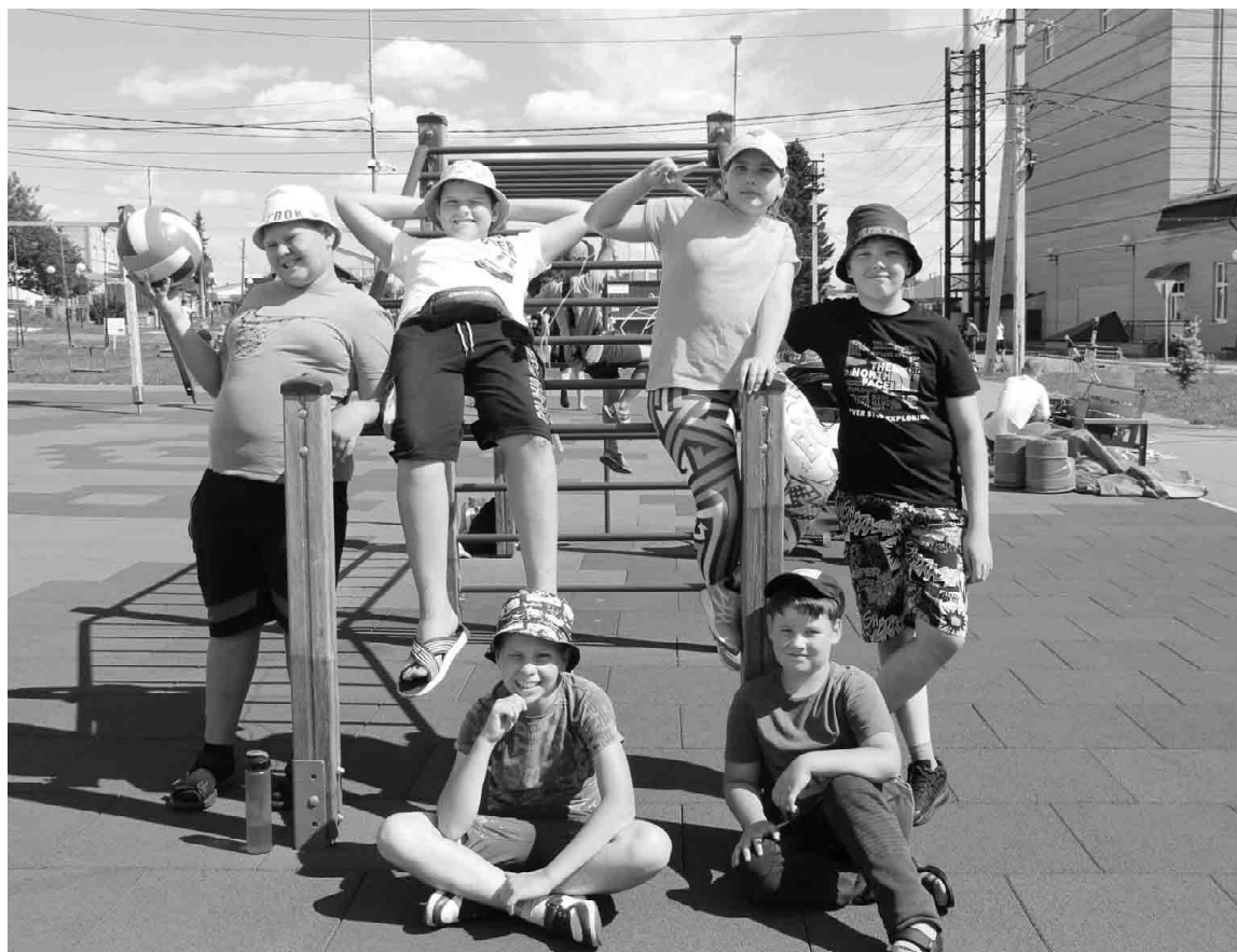
В парке «Семейный» хватает развлечений для детворы

В Центральной библиотеке завершилась вторая смена детского лагеря