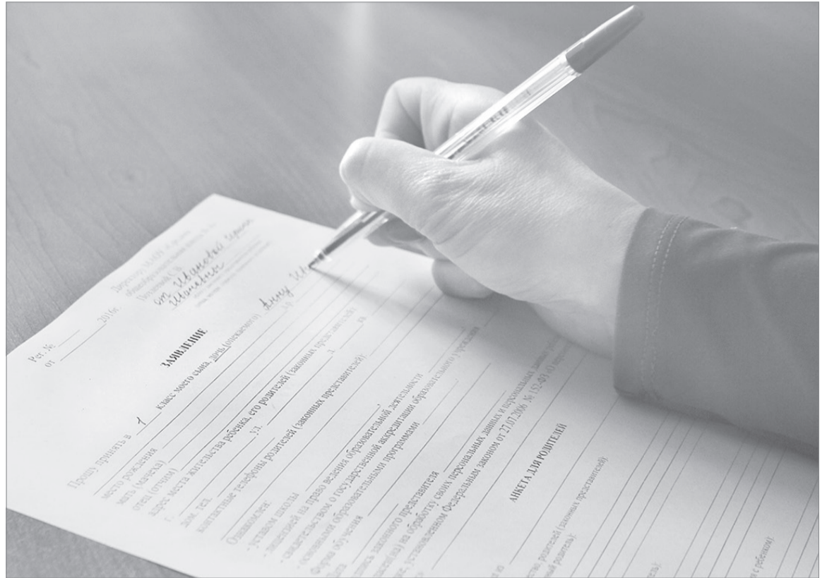
Заявление о приёме ребёнка в первый класс можно подать как лично, так и через интернет