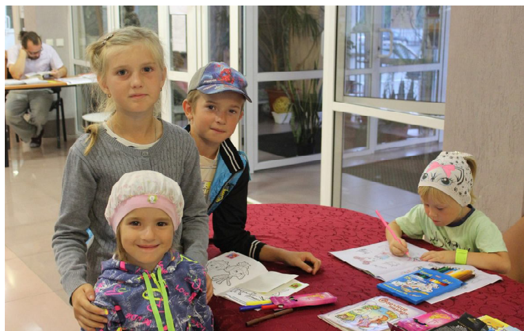
Раскрашивать картинки - увлекательное занятие