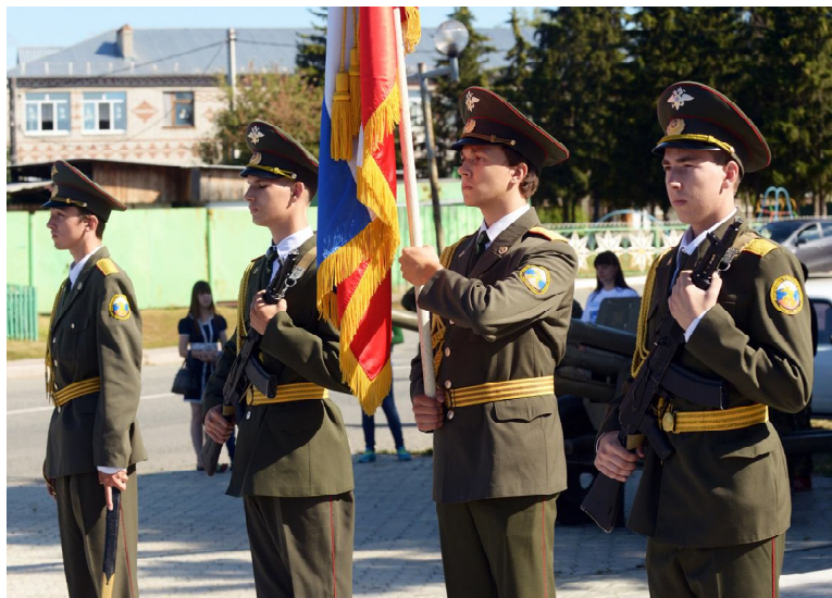
Торжественное открытие игры. Знаменная группа с флагом Российской Федерации