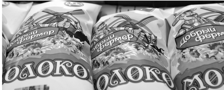
Продукция торговой марки «Добрый фермер»

- Привезенное сырье поступает в приемную емкость. Если анализ соответствует микробиологии, физико-химическим показателям, начинаем переработку молока. Смесь пастеризуется, сепарируется, гомогенизируется в соответствии с производимым продуктом. Цель-