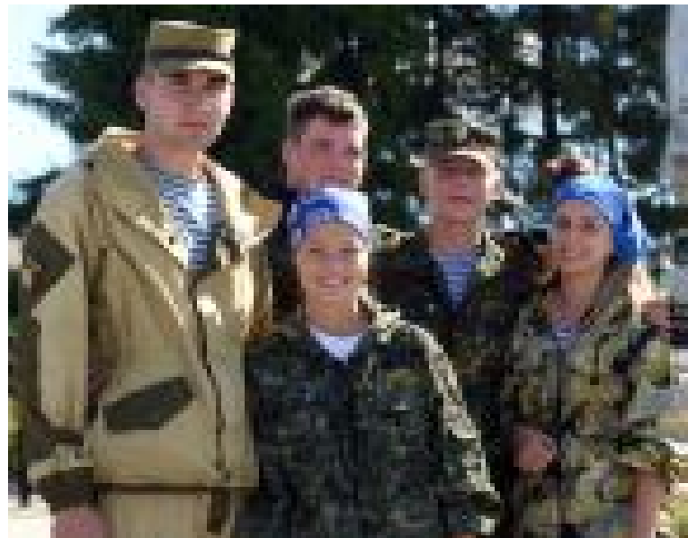
Участники военно-спортивной тактической игры «Большие манёвры - 2016»