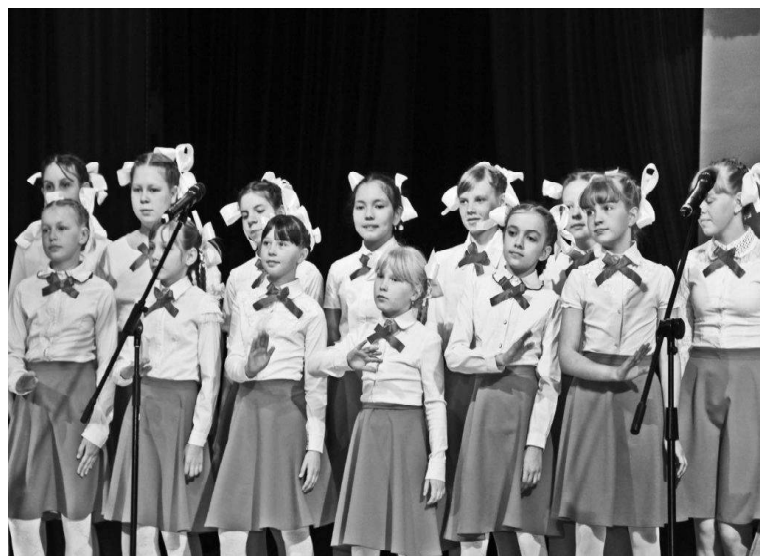
• Памятная дата