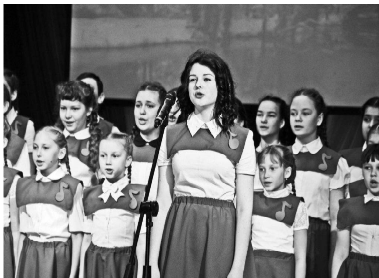
• Цифровое ТВ