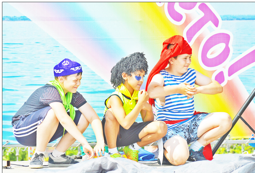
Яркие костюмы ребят из центра развития детей точно передавали образы героев всем известного кинофильма «Кавказская пленница»