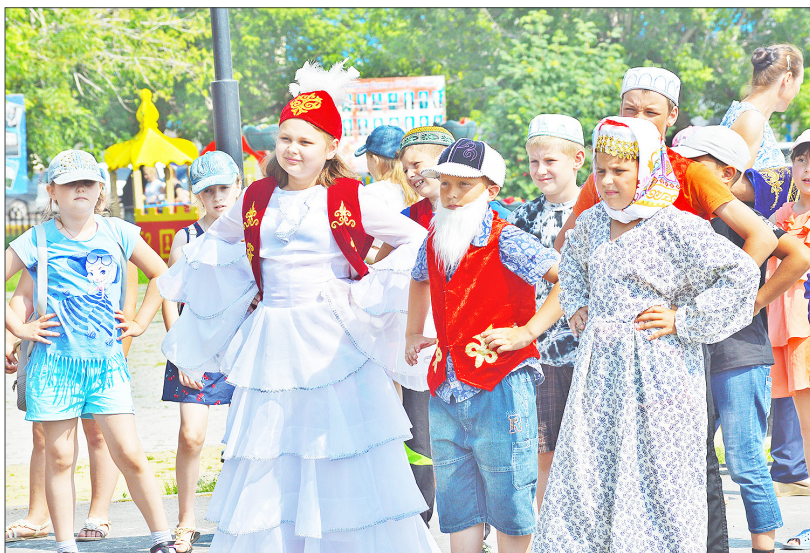
Участники мероприятия не только охотно выступали на сцене, но и с удовольствием смотрели театрализации других артистов