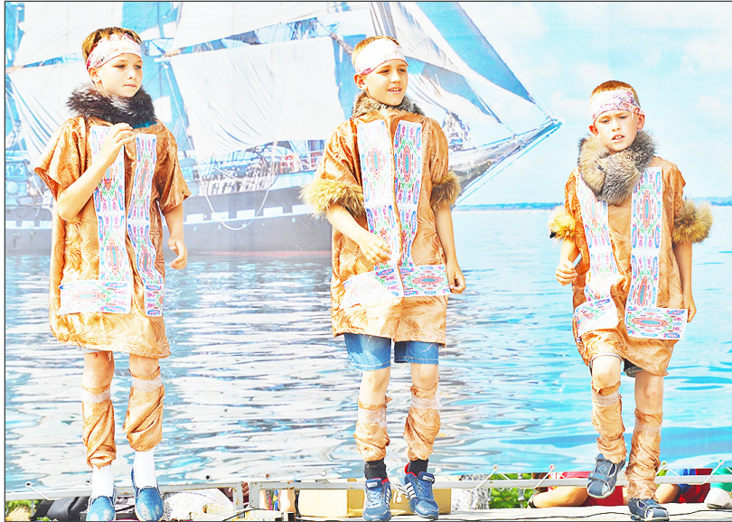
Юные актёры из Новоселезнёвской школы выступили с поучительной ненецкой сказкой «Кукушка», показав зрителям, что может случиться с непослушными сыновьями

Каждый школьный отряд подготовил инсценировку какой-либо небольшой народной сказки. Так, большеярковцы показали белорусскую сказку «Пых», новоселезнёвцы – поучительную ненецкую сказку «Кукушка». Ребята из Большой Ченчеры вышли на сцену с немецкой сказкой «Три бабочки», ильинские и дубынские подростки выступили с инсценировками казахских сказок «О хитром Алдар-Косе» и «Мудрая девушка Алтынай», артисты из Ка-