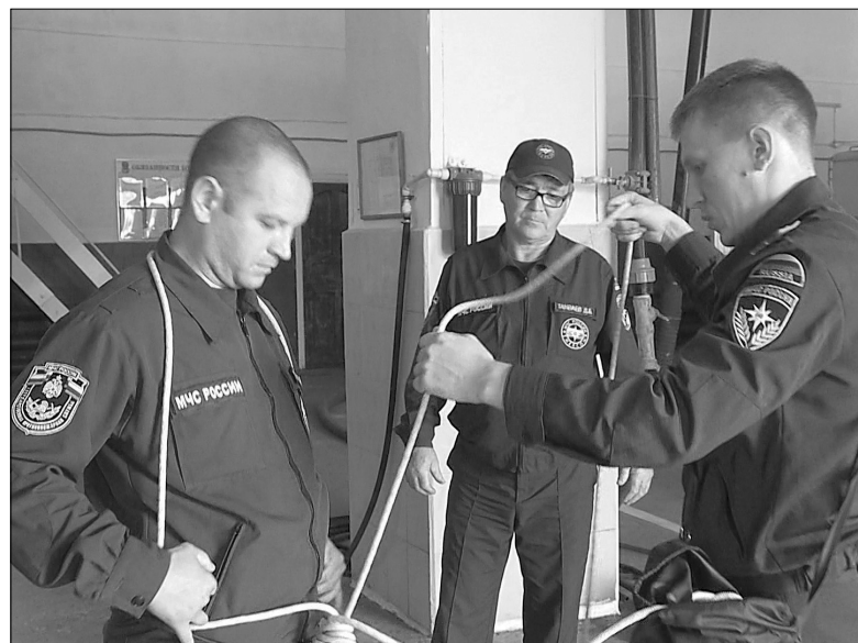
Многие нормативы спортивной подготовки в пожарном отряде члены караулов все вместе отрабатывают на ежедневных занятиях

строительство помещения. Через несколько месяцев упорной работы червей навоз превращается в богатый микроэлементами гумус. Когда продукт «созревает», видно по гранулам. Их выгребают из гряды, просеивают, убирая червей и мусор, и укладывают в полиэтиленовые пакеты.