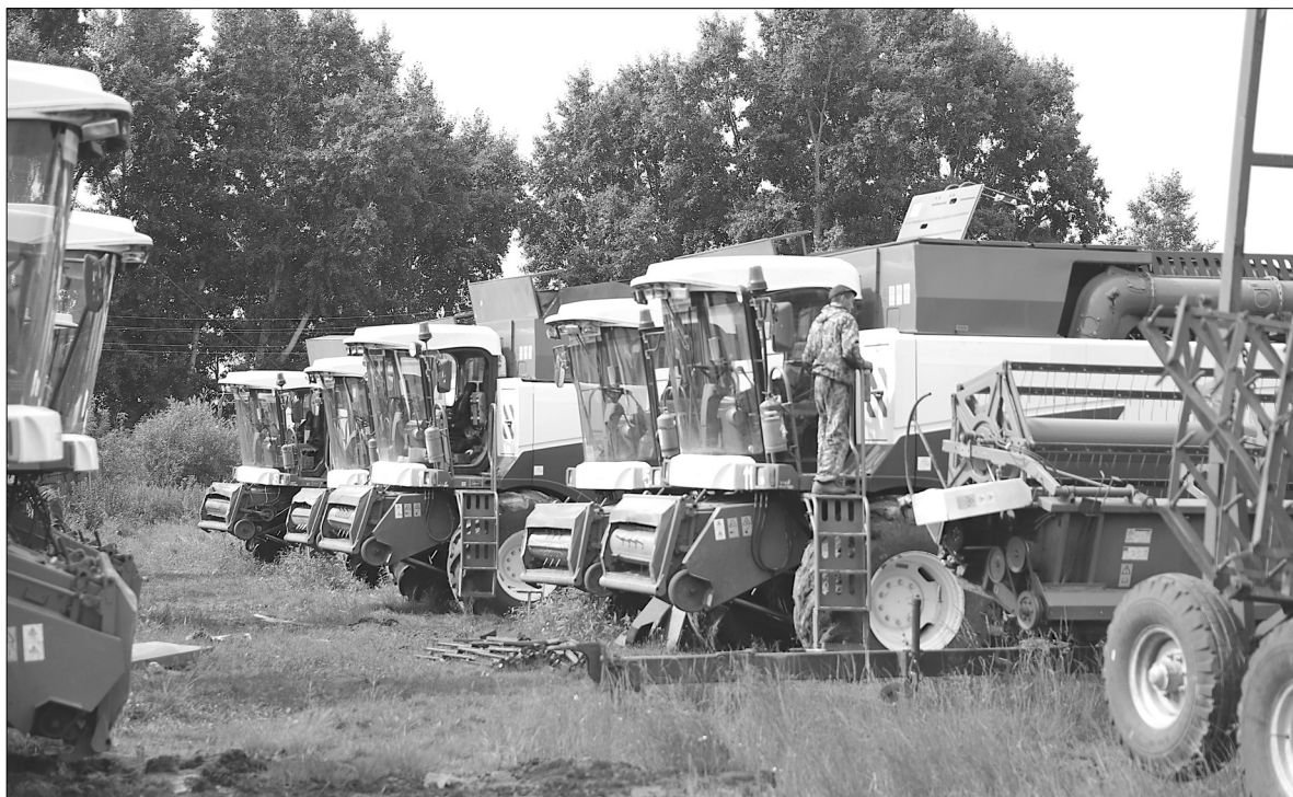
Комбайны скоро выйдут на жатву

Наталья ГЛАДКОВСКАЯ.