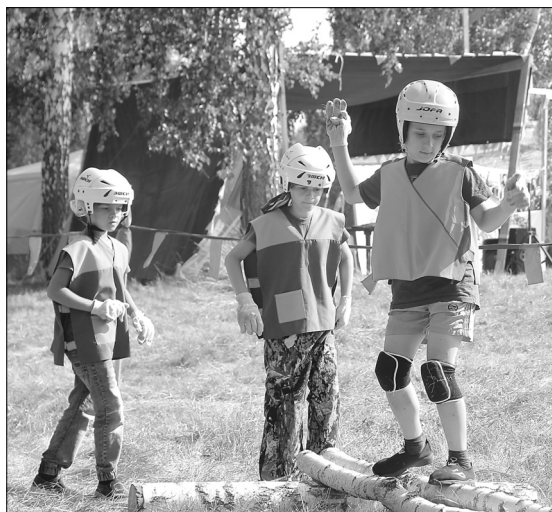
Самые юные участники вышли на «Тропу туристят»