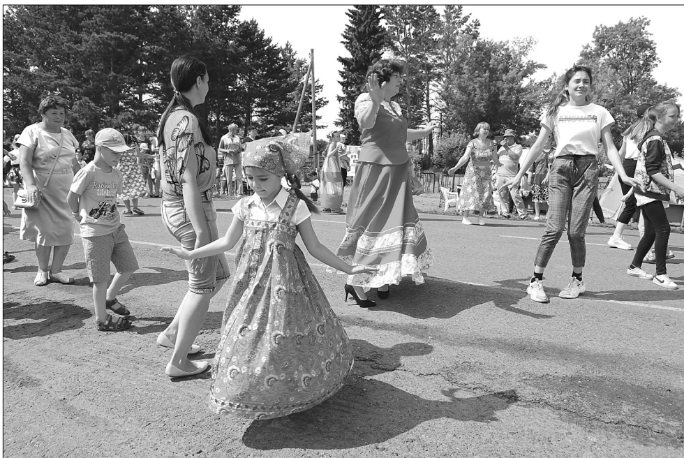
На народных гуляньях гости не скушали – плясали от души