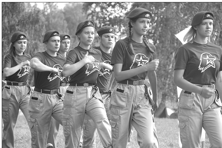
Смотр строя и песни открыл программу соревнований, впервые в слёте участвовали юнармейцы

Надежда ЧЕРЕПАНОВА.