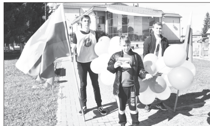
Волонтеры юному упоровцу вручили шары и листовку.

День Государственного флага Российской Федерации празднуется двадцать четыре года. Он не является выходным и посвящён возрождённому национальному триколору.