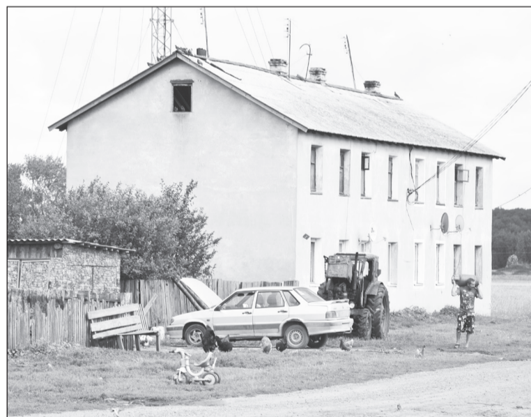
В обычном двухэтажном доме расположились необычные двухуровневые квартиры.

Двухуровневые апартаменты, иначе говоря, квартиры, расположенные сразу на двух этажах, со средневековья остаются признаком не только рациональности и удобства, но и роскоши. Например, «родственников» такой квартиры – таунхаусы – в Англии во времена правления королевы Виктории заселяли знатные люди. На Руси, где семьи были большими, проблем с землёй не было, но двухэтажные дома строились даже не очень богатыми людьми – купцами, ремесленниками, зажиточными крестьянами. В этом случае – жильё, спальные комнаты располагались на верхнем этаже, а первый же выполнял больше хозяйственную функцию – здесь находились кухни, кладовые, мастерские.