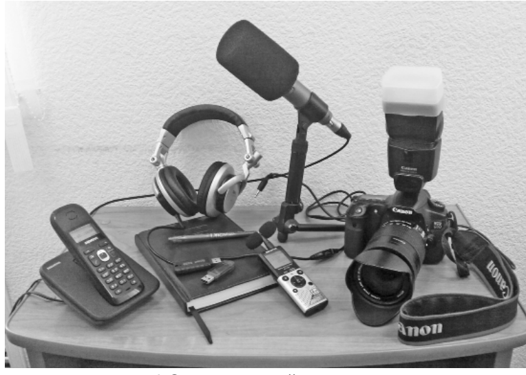
* Современный «арсенал» журналистов.

Что значит быть корреспондентом районной газеты в современное время? Наши журналисты давно не пишут только на одну определённую тему. Поверьте, я знаю, о чём говорю, опыт за плечами не маленький. Когда начинала работать, пишущих сотрудников было пять, сейчас – двое. Мы должны стать универсалами, не забывая быть специалистами. И это нелегко! Это на самом деле очень трудно... Возьмите в руки любой номер газеты. На его страницах материалы на темы из самых разных сфер – образование, здравоохранение, бизнес, культура, патристическое воспитание, спорт и физическая культура, правовая защита, молодёжная политика, сельское хозяйство. Вы не поверите, но иногда меня мучают кошмары, связанные с публикациями про АПК. Для меня