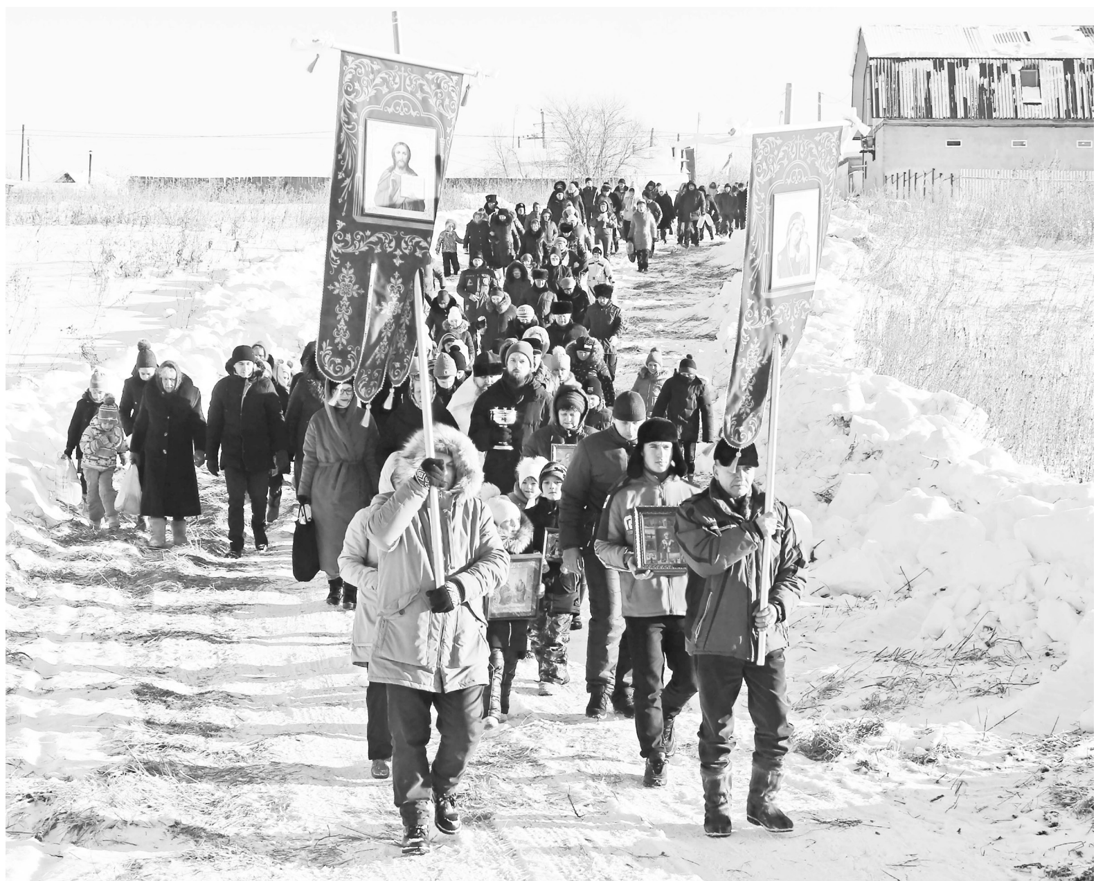
Крестный ход православных людей к «иордани». Село Иска. 19 января 2019 г.