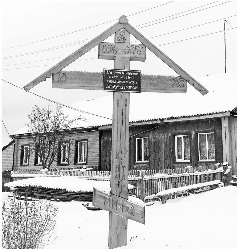
Первый храм «Вознесения Господня» был открыт для прихожан с 1896 по 1956 годы.

– Мы люди пожилые, крещёные, а жизнь православного человека без храма и представить себе невозможно. Поэтому мы ездили в Красный Яр,