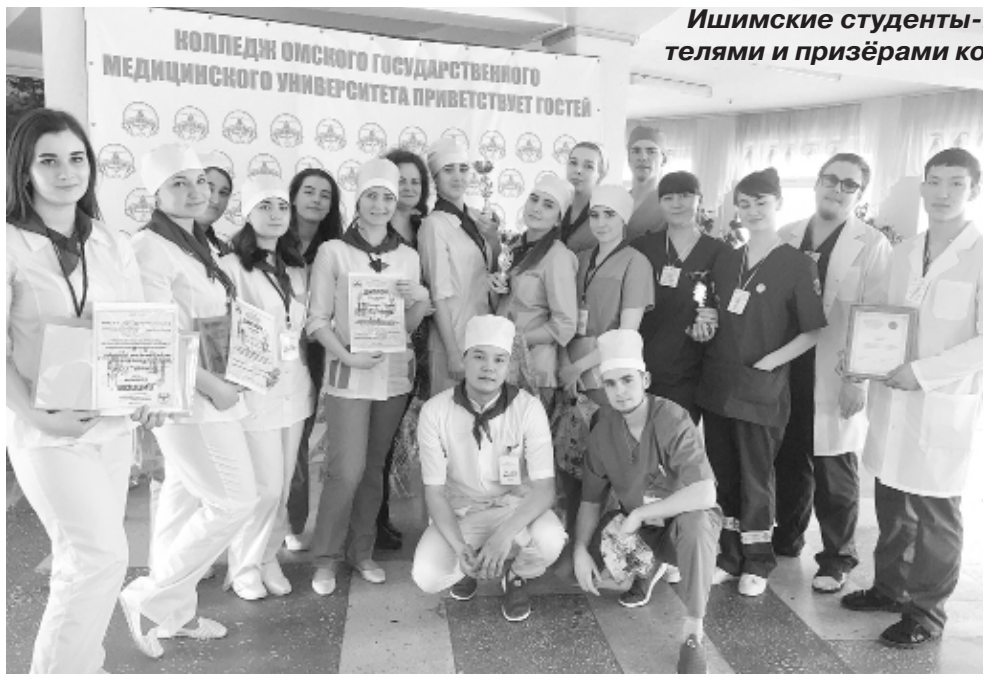
Ишимские студенты-медики вновь подтвердили высокий уровень компетенций, став победителями и призёрами конкурсов профессионального мастерства.