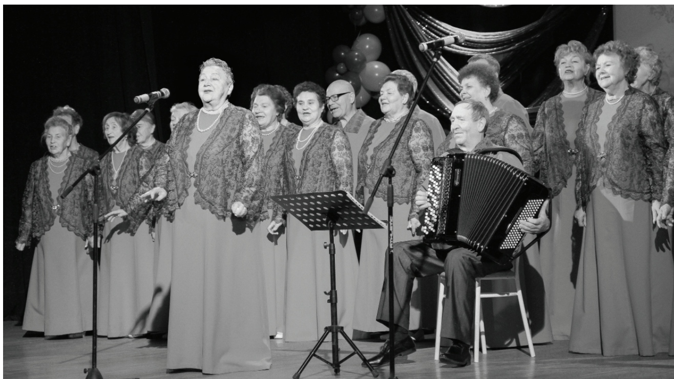
Наиболее часто звучат в исполнении хора песни о любимом Ишиме, написанные местными авторами.