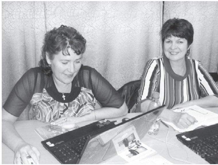
|| Фото из архива Галины Ламбиной

— У нас набралась разновозрастная группа, ездили мы учиться в райцентр. Это было в 2010 году. Было сложно понять всё, что нам говорили, но мы старались. Все записи я сохранила, и они очень мне пригодились, когда в нашей библиотеке появился компьютер,