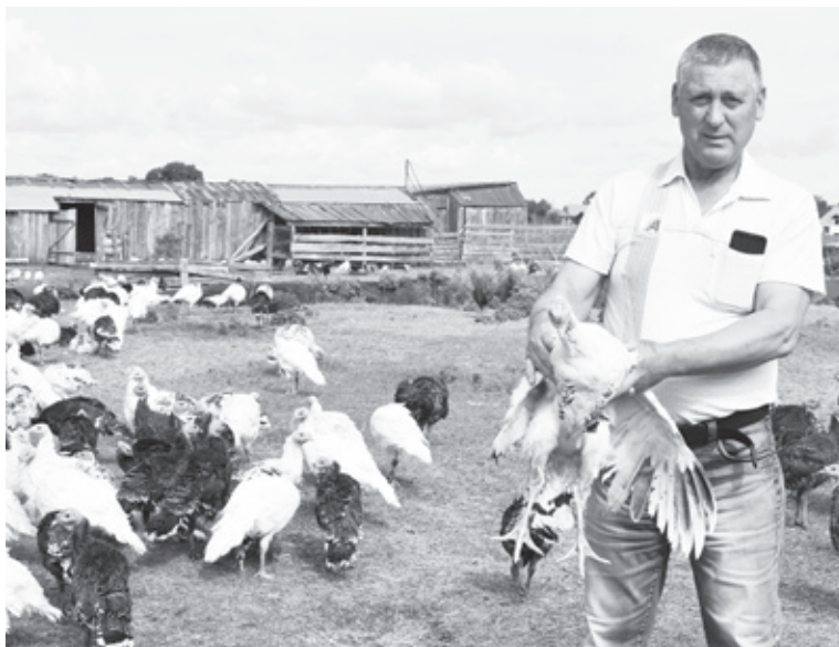
II