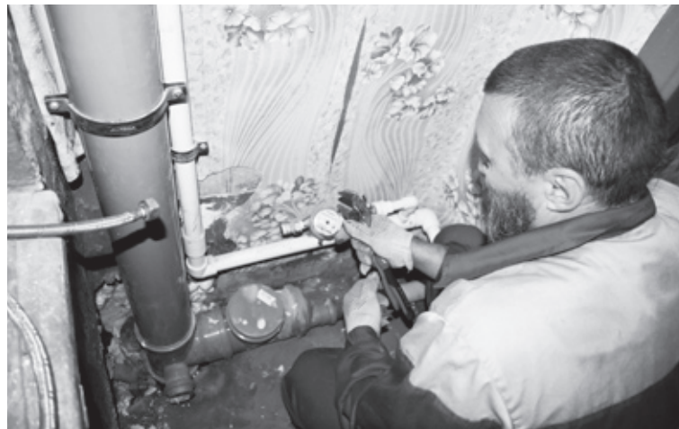
|| Замена подлежат водопроводные и канализационные трубы.