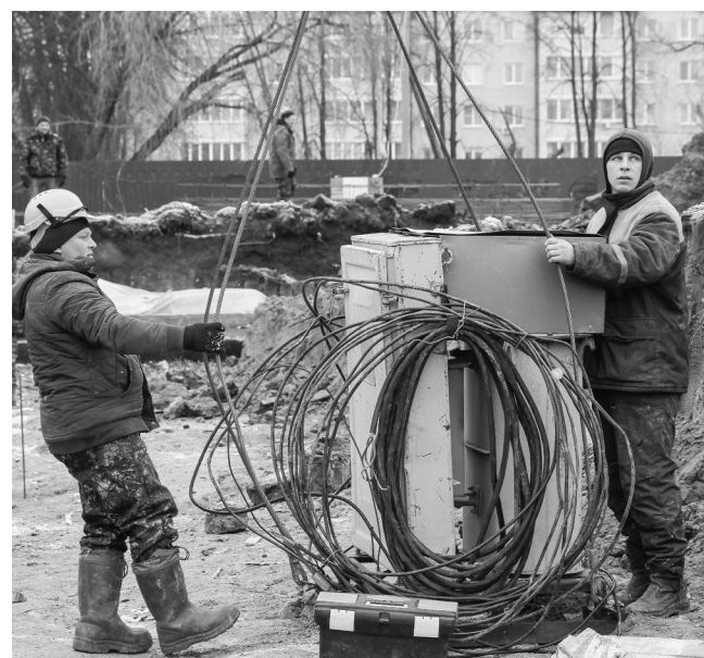
Строители готовят котлован, закладывают подушки и монолитный пояс под будущий фундамент.

– Ишиму уже давно нужен большой современный культурный центр, который сможет вместить большое количество зрителей, принять гастроли крупных творческих коллективов. Я благодарен ишимцам за то, что поддержали именно этот объект. После долгой подготовительной работы строительство, наконец,