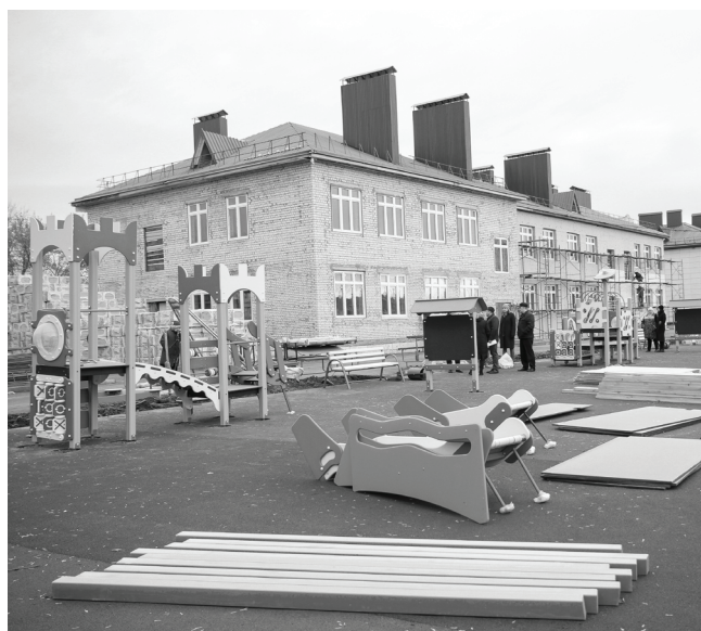
На месте старых деревянных корпусов будут яркие игровые площадки.

Продолжается строительство нового корпуса детского сада № 5.