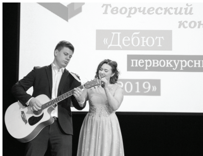
Молодежь демонстрировала таланты в номинациях «вокал», «театр», «оригинальный жанр», «художественное слово» и «хореография».

Впервые «Дебют первокурсника» в Ишиме собрал студентов из педагогического института, многопрофильного техникума и медицинского колледжа на одной сцене.