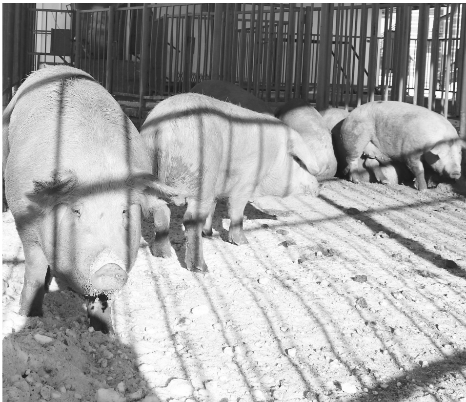
В убойный цех поступило 12 голов животных из Свердловской области.

По нашему району объём свинины пока небольшой, больше везут из других регионов. Однако за небольшой период в цех поступило около шестисот голов КРС. Сейчас используем электроэнергию и солярку (на крематоре) – дорого, конечно. В настоящее время заключены договоры, сделана предоплата на газификацию предприятия.