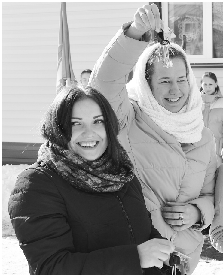
Счастливые обладательницы ключей от новых квартир не скрывают эмоций.