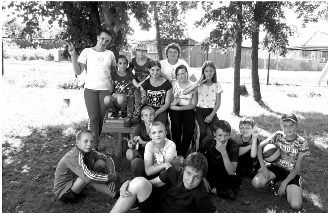
► Летний лагерь в Каргалах

Детям постарше разрешилось плавать на глубине. Не умеющим плавать детям выдавали специальные пояса, поддерживающие их на воде. Сколько радости и веселья доставило детям купание! Посещение бассейна благотворно влияет на детей, закаляет их, укрепляет все виды мышц и нервную систему. Дети, посетившие бассейн, согласны с тем, что водные процедуры самые зазорные! Под чутким вниманием воспитателей лагеря и инструкторов бассейна дети не только развлекались и оздоравливались, но и учились держаться на воде и плавать. Ведь плавание один из замечательных видов спорта! Это наиболее гармоничная, сбалансированная физическая нагрузка. Плавание является оздоровительным спортом и залогом крепкого здоровья. Ребята хорошо отдохнули, купались, наплескались. Впечатления детей после посещения бассейна самые положительные.