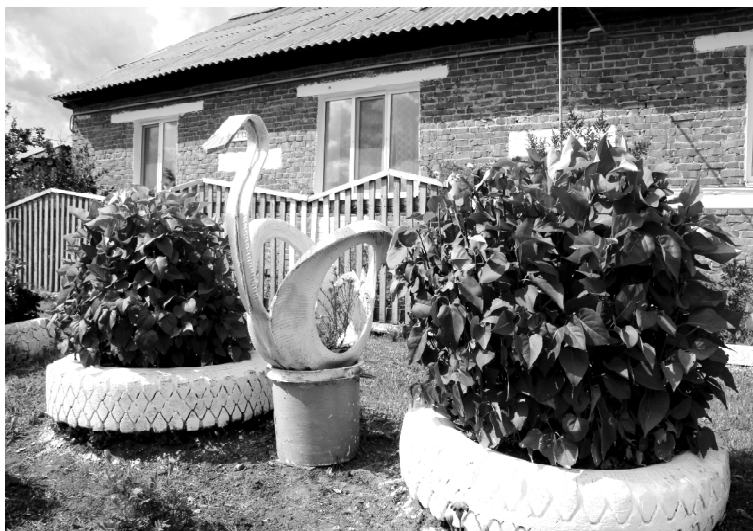
«Лебеди» Новиковых