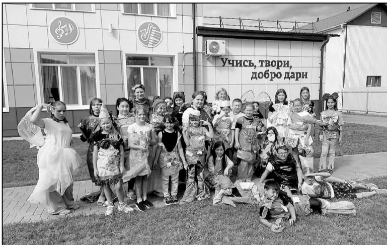
Ребята с удовольствием посещали «Цветик-семицветик».

В июле в Онохинской детской школе искусств, в лагере с дневным пребыванием детей «Цветик-семицветик» состоялась творческая смена «Блог твоего лета».