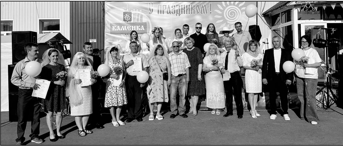
На празднике состоялась торжественная регистрация 11 пар, отметивших юбилеи совместной жизни.