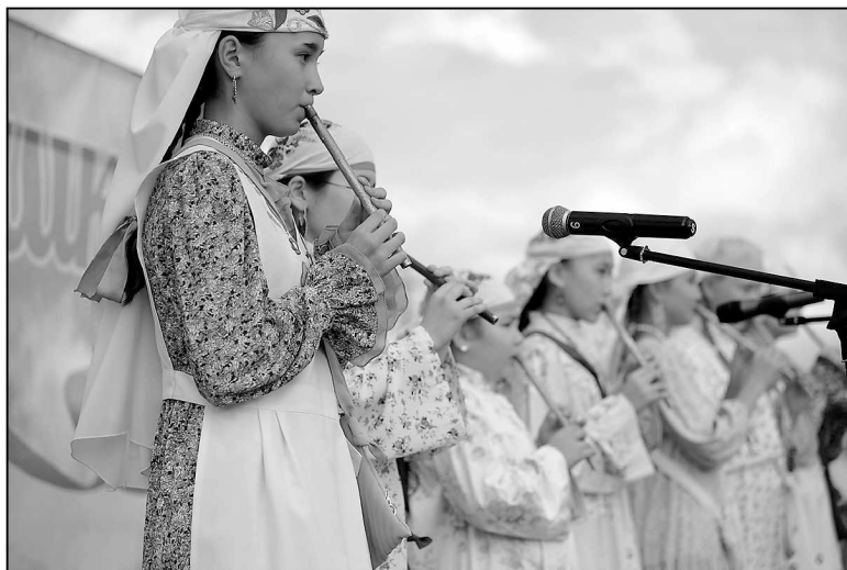
Народные мелодии – на радость землякам.

Специалисты сельского клуба. с. Каменка.