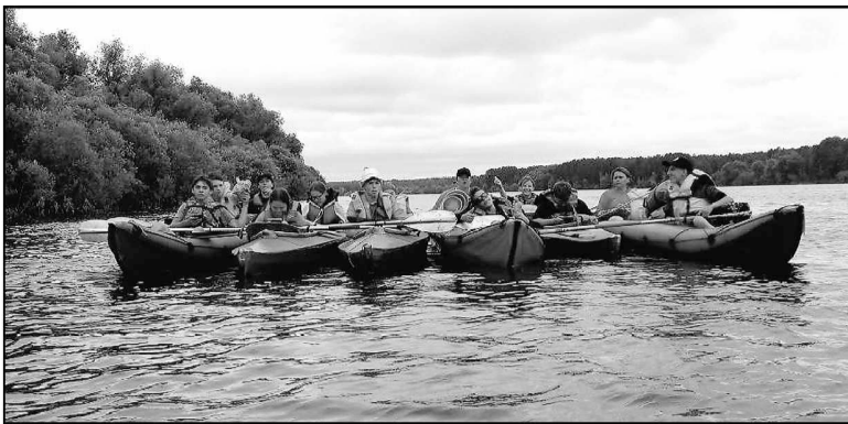
Участники сплава получили незабываемые впечатления.