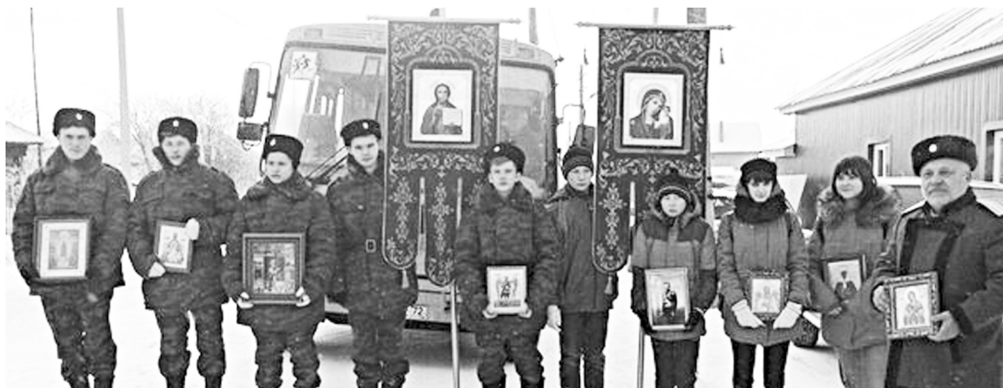
Юные патриоты Нижнетавдинского района – воспитанники казачьего класса Тюнёвской средней школы.