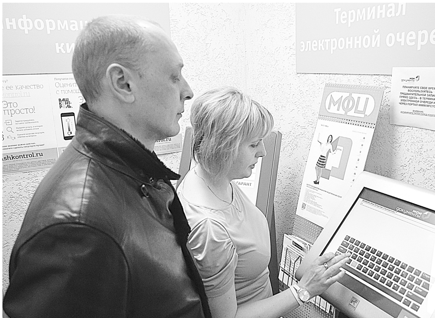
Специалист МФЦ показывает посетителю, как записаться в терминале электронной очереди на получение услуги.