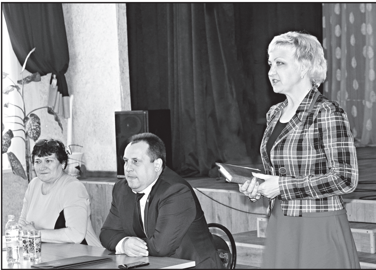
О новом в Пенсионном фонде

Общая площадь земель муниципального образования – 16453 гектара. Протяжённость улиц внутри поселения составляет почти десять километров. Плюс деревня Барсуки – четыре километра. Численность населения на начало 2018 года составила 580 человек. Родилось в 2017 году пятнадцать детей, умерло семь человек: демографические процессы со знаком плюс. На территории поселения функционирует основная общеобразовательная школа: обучается 44 ученика, детский сад посещают