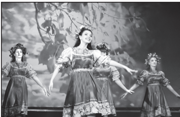
Танец – в подарок от ансамбля «Новые горизонты»