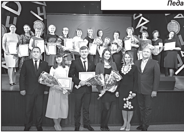
Участники конкурса «Педагог-2018»

Учителя порой сравнивают со свечой, которая горит, освещая путь другим. При этом сама сгорает. Согласитесь, верно подмечено. Чтобы не просто дать знания детям, а оставить в их душе прекрасные воспоминания о школе, нужно очень сильно любить своё дело. Нужно «жить, гореть и не угасать», как это делают участники районного конкурса «Педагог года».