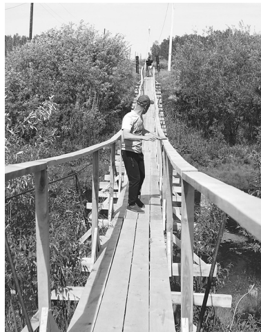
Обновлённый мост для бескозобовцев

Бескозобовцы не только ждут инициативы со стороны местных властей, но и сами активно участвуют в благоустройстве своего села. В начале июля на центральной усадьбе, возле сельского Дома культуры, торжественно