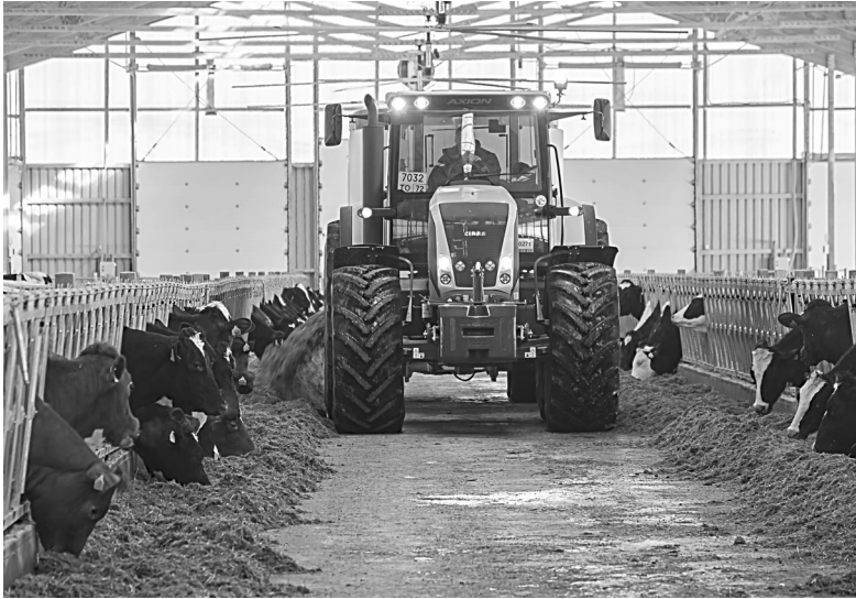
На мегаферме в селе Усть-Ламенка у коров сбалансированный рацион питания

ООО «Тюменские молочные фермы» группы компаний «Дамате» запасают сочные и грубые корма для сытной зимовки сельскохозяйственных животных.