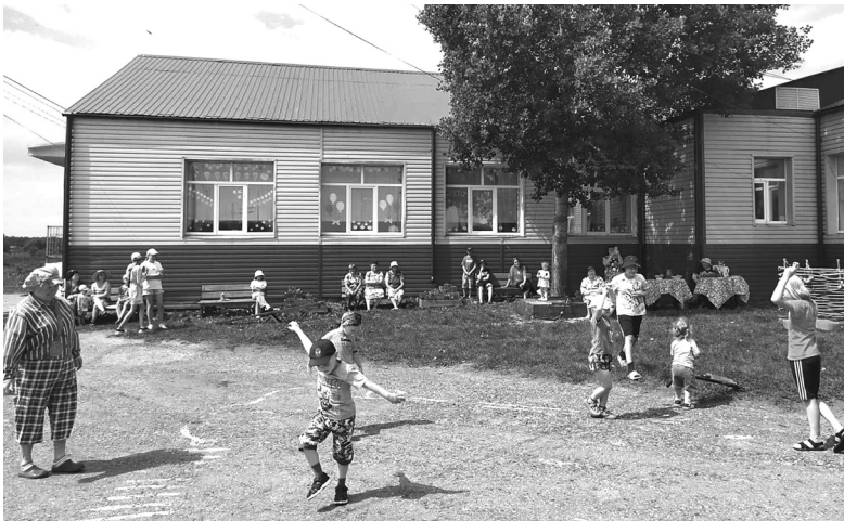
Селяне уже полюбили новую зону досуга: взрослые здесь общаются и отдыхают от повседневных хлопот, дети – играют

Благоустроительные работы на Бескозобовской сельской территории начались с субботников. В них участвовали работники учреждений социальной сферы и владельцы личных подворий.