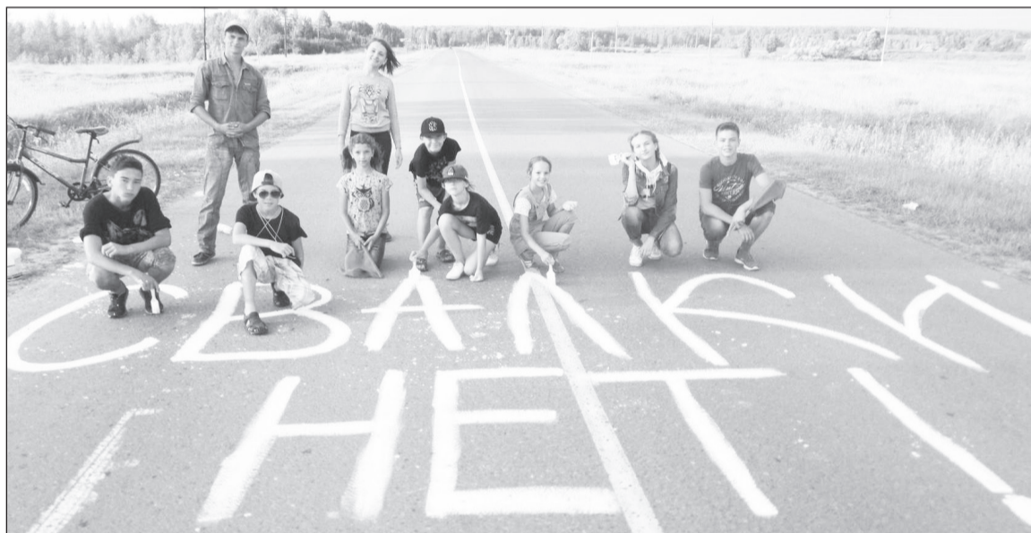
Акция волонтерского отряда «Старт мечты» «Свалки нет».

Ещё один вопрос, поднимаемый весной на сельском сходе, – пешеходный мост через Чёрную, к которому стекаются все короткие тропки. Требуемый ремонт был сделан.