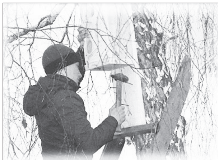
Учащиеся школы готовы к встрече пернатых друзей, участвуя в акции «Каждой птичке нужен дом».

Несколько раз выходили на субботники, чтобы привести