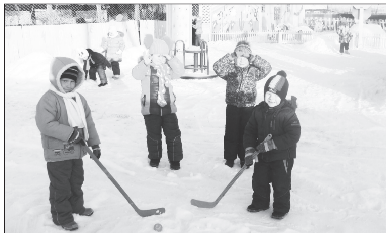
Мальчишки детского сада «Солнышко» приобщаются к здоровому образу жизни.