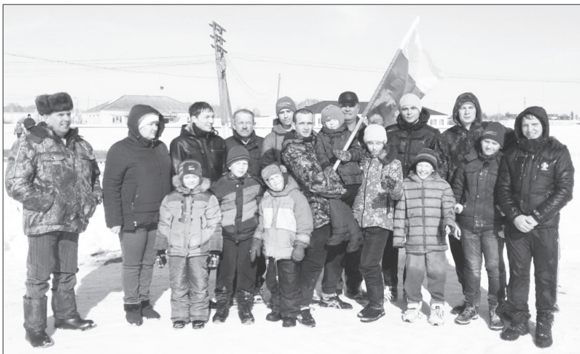
Участники ежегодной военизированной эстафеты, посвящённой 23 февраля.

При храме работает социальная лавка. Люди приносят сюда одежду и обувь в хорошем состоянии, а нуждающиеся берут здесь то, что им нужно. Особенно радостными уходят из лавки дети, любят они обновы. Мы начали формировать книжный фонд православной библиотеки, для этого уже собрано большое количество книг и молитвословов.