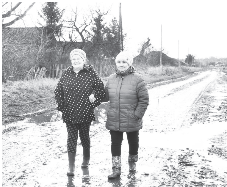
Подруги отправились в Нижнеманайский магазин.