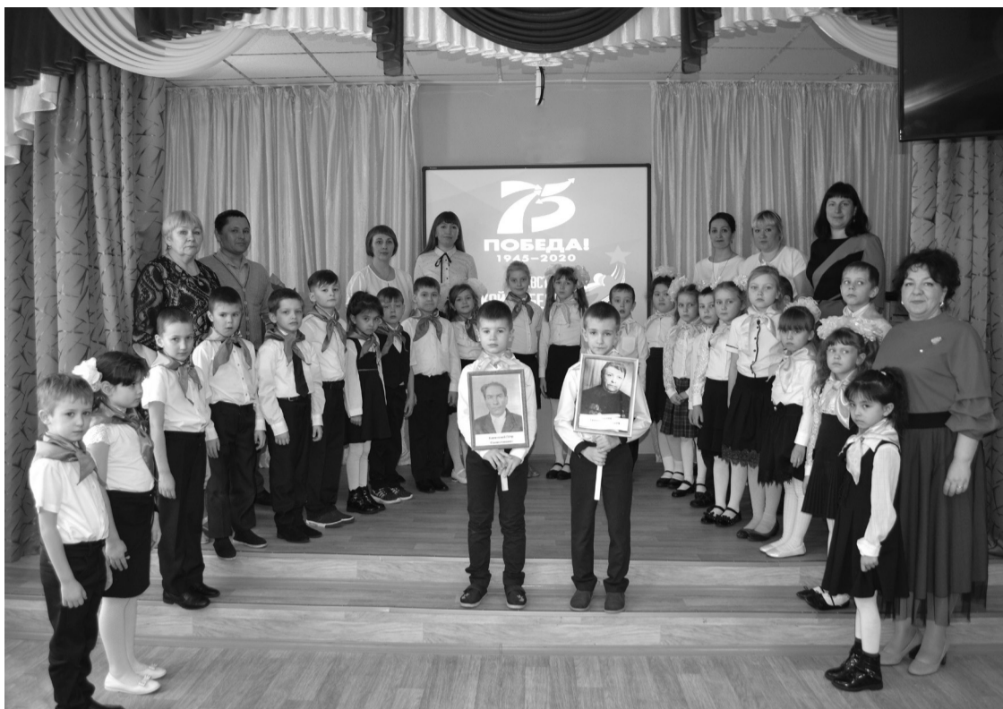
На снимке: ученики 1 «Б» класса перед выступлением