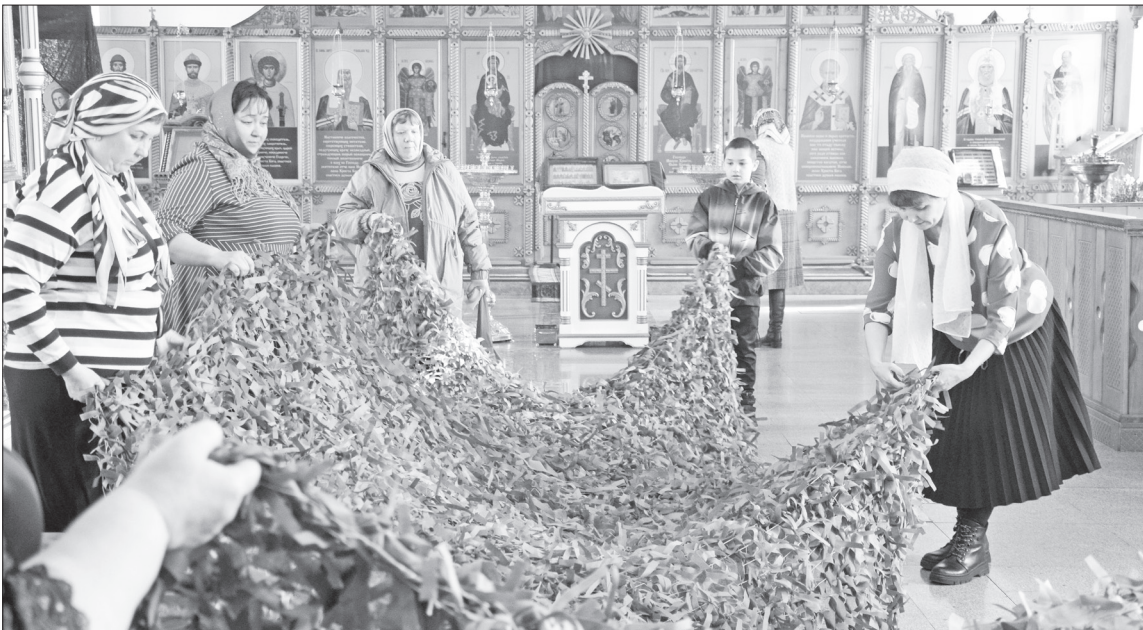
Прихожане Храма Святой Троицы активно включились в плетение маскировочных сетей.