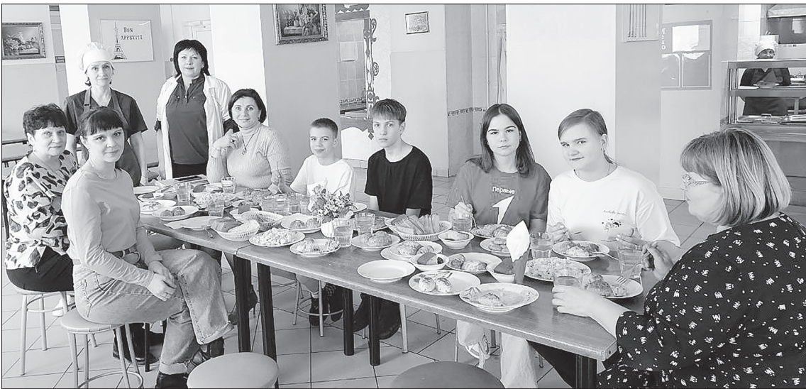
Комиссия готова попробовать новые блюда.

Представленные блюда: люля-кебаб из птицы с маслом, вершинки рыбные с маслом, манник с джемом, тефтели из говядины с рисом, запечённые с соусом, паста «Карбонара» с сыром и мясом птицы, голубцы ленивые, запечённые с соусом, наггетсы из курицы за-