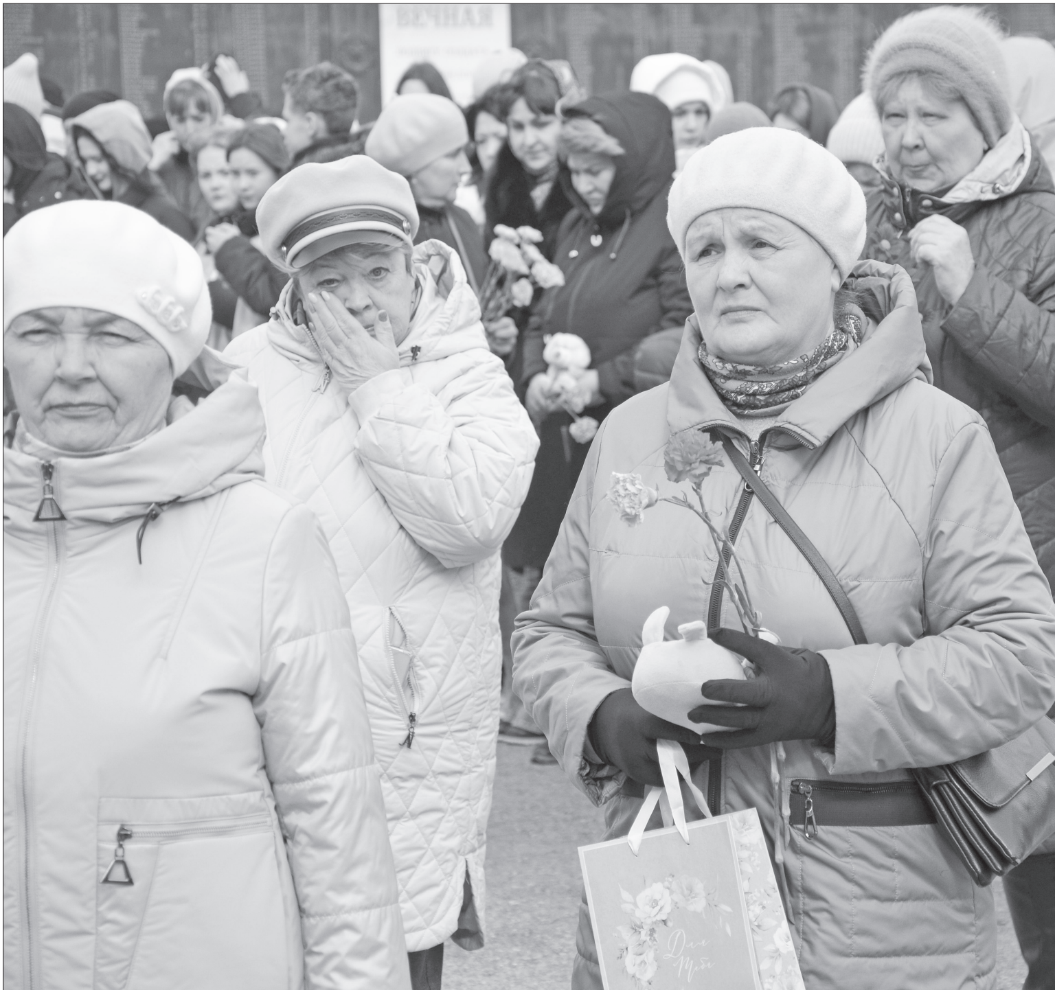
Нижнетавдинская общественность отдала дань памяти жертвам теракта в Подмосковье, возложив цветы, игрушки и лампы к мемориальному комплексу.

В общенациональный день траура нижнетавдинцы возложили цветы в память о погибших в результате теракта в Подмосковье