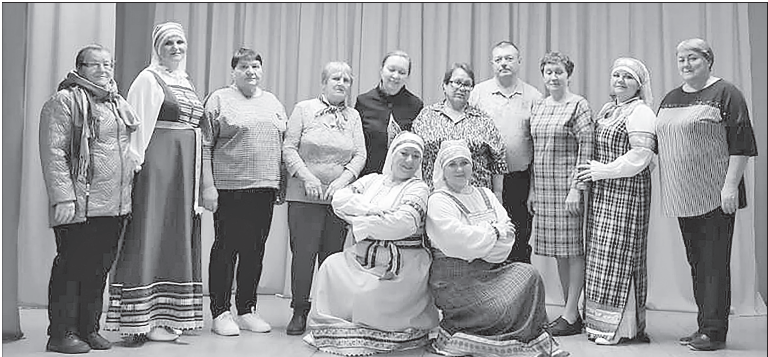
Творческий тур юбиляра – коллектива «Златница».

Александр Моор – губернатор Тюменской области