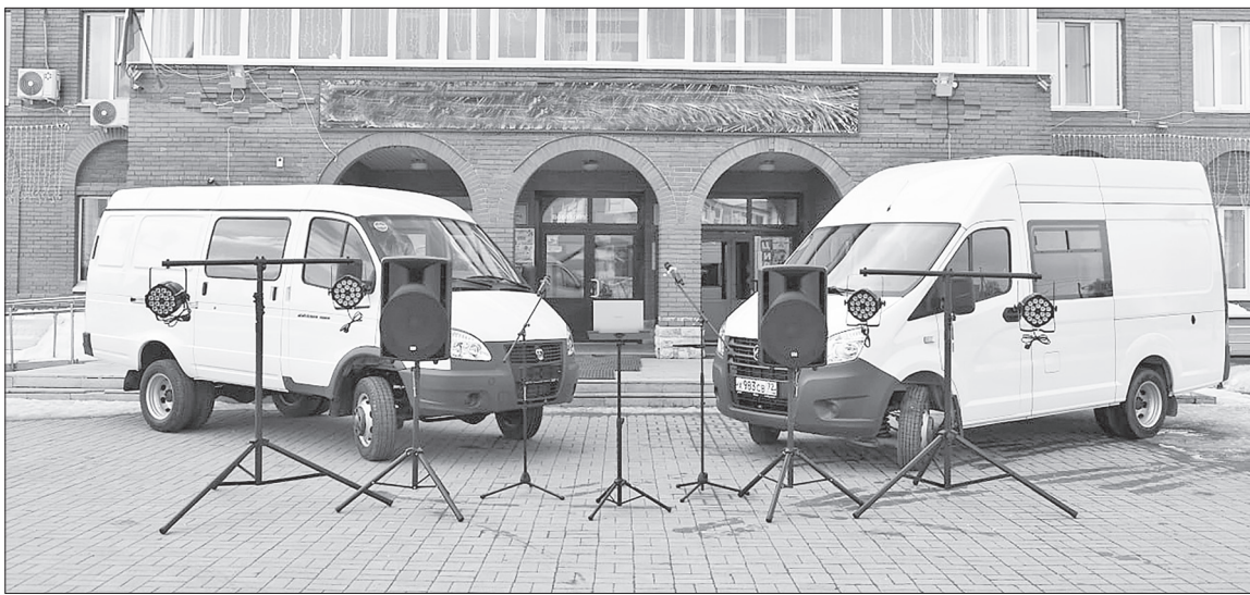
■ В Нижнетавдинский район для работников культуры поступило два новых автомобиля – «Газель Бизнес» и «Газель NEXT».

Поехали. Работники культуры – люди непоседливые, так как они несут культуру даже в самые отдалённые уголки нашего района. И тут им никак не обойтись без четырёхколёсных «друзей». В рамках реализации государственной программы Тюменской области «Развитие культуры» в автономное учреждение «Культура» Нижнетавдинского района поступило два новых автомобиля – «Газель Бизнес» и «Газель NEXT». Машины оснащены самым современным оборудованием для проведения различных мероприятий. Это и акустические системы, вокальные радиосистемы, ультрабуки, проекторы, сцены-трансформеры. Такие автомобили позволяют