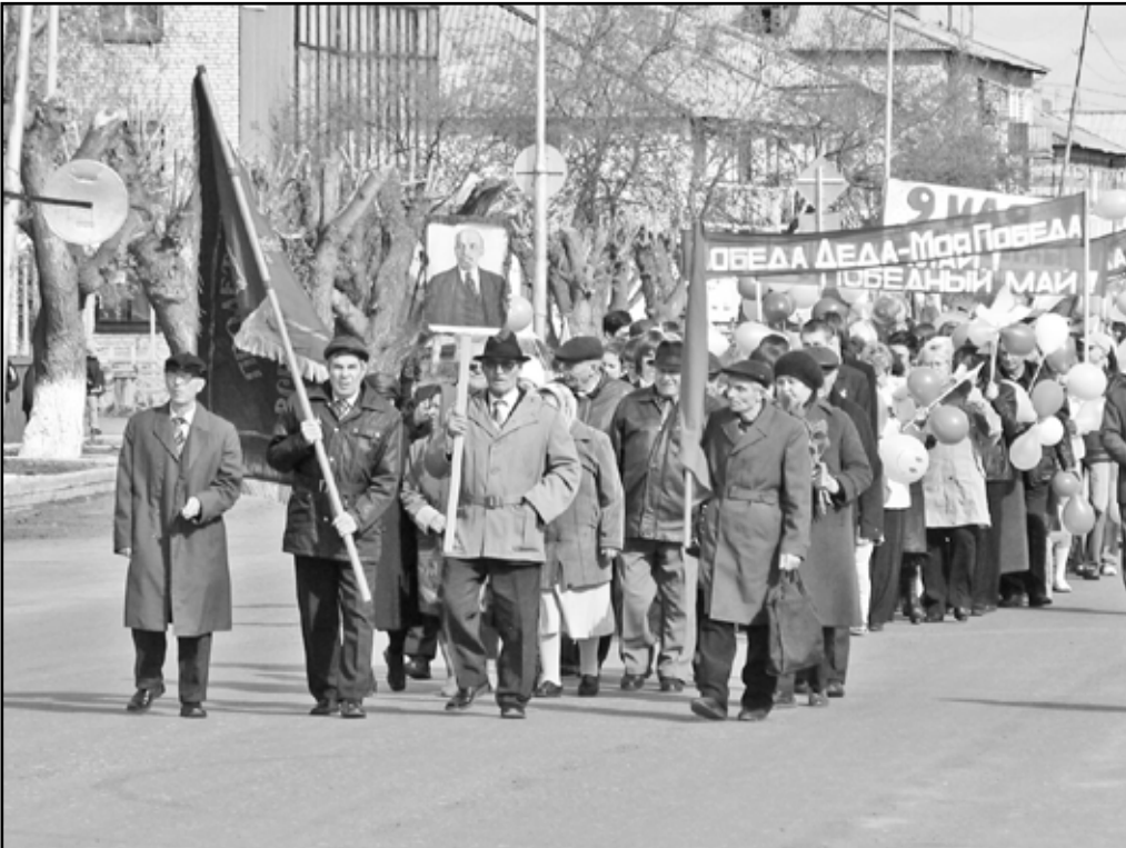
Праздничное шествие колонн. 2007 год