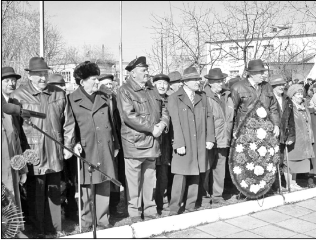
Участники Великой Отечественной войны на праздничном митинге. 2004 год

за несколько лет. В редакции сохранился архив фотографий с 2003 года. Мы отобрали самые значимые из них, характеризующие праздник Победы. Посмотрите. Вспомните. Сравните. Мысленно поклонитесь тем, кого уже с нами нет. Скажите доброе слово живущим ветеранам. И пусть День Победы для каждого и дальше будет главным государственным праздником.