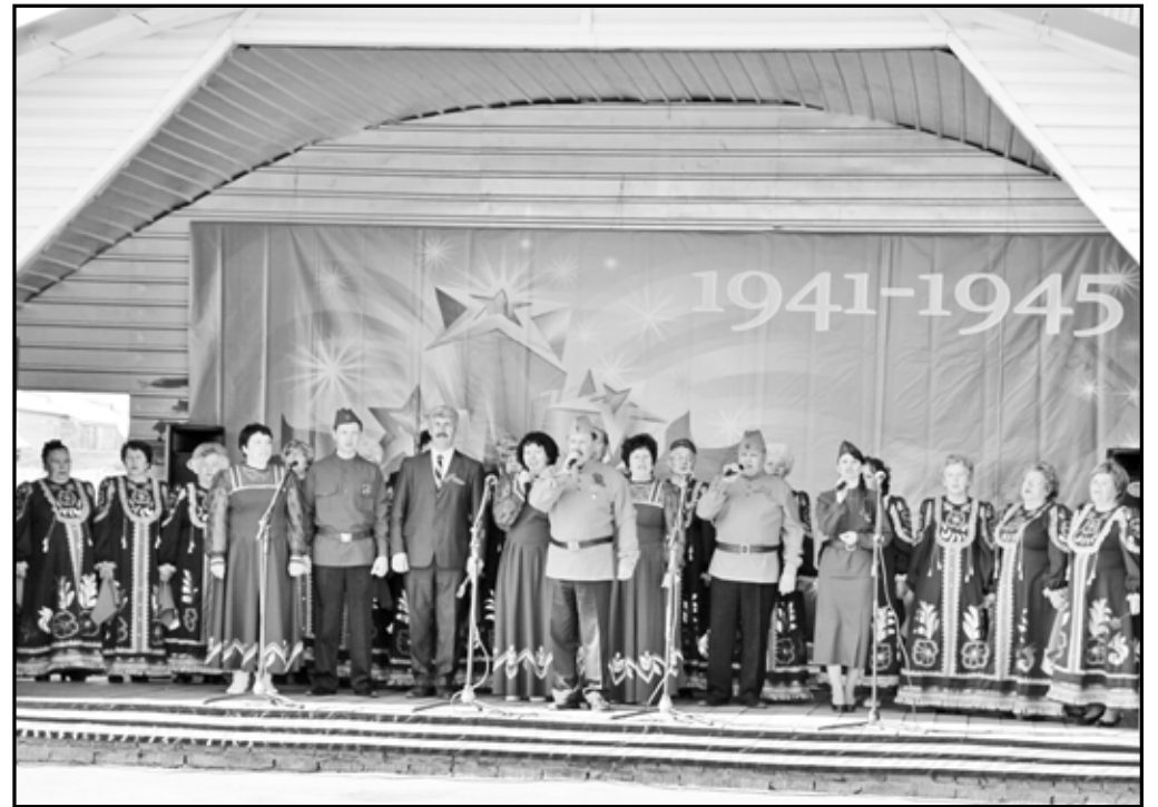
Большой разноплановый концерт ежегодно готовят к 9 Мая работники культуры района. 2012 год