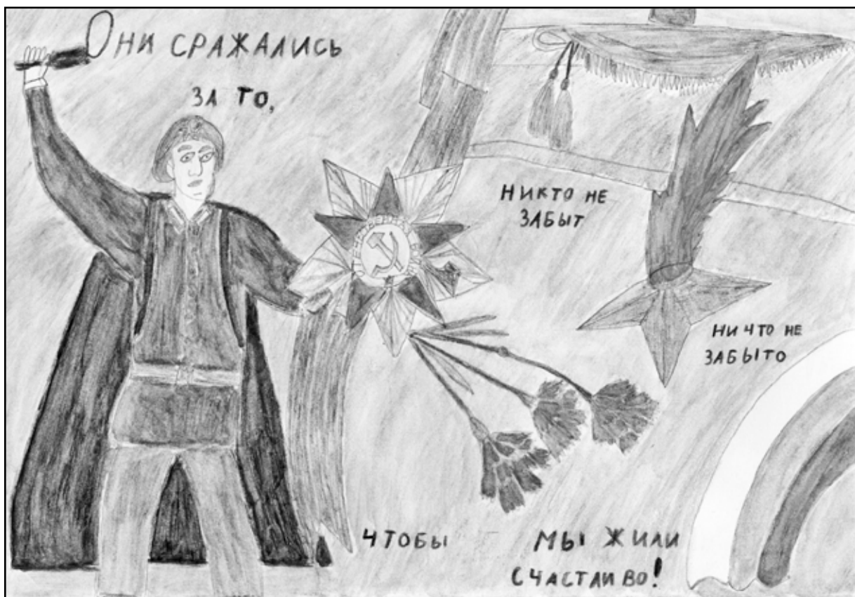
Рисунок Ивана ЭСТРИХА, ученика 1 «а» класса Казанской школы