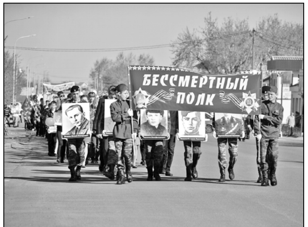
Бессмертный полк, состоящий из героев войны, с каждым годом растёт. 2014 год