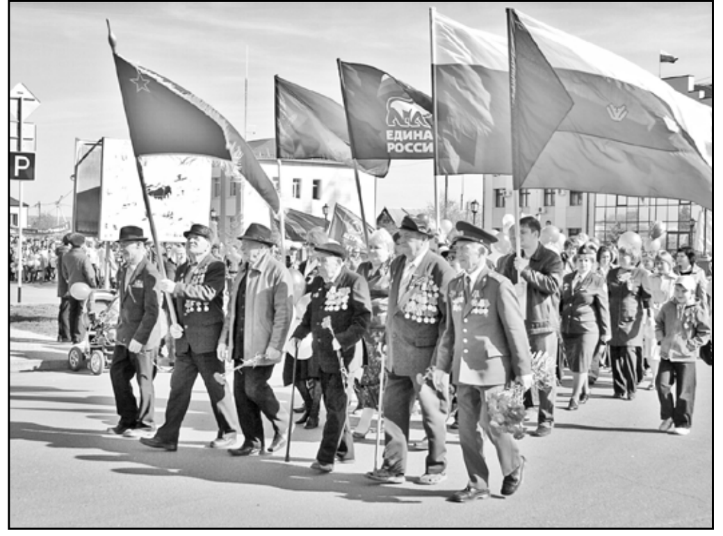
Во главе праздничной колонны рабочих, служащих, учащихся, жителей райцентра шагают ветераны войны. 2011 год