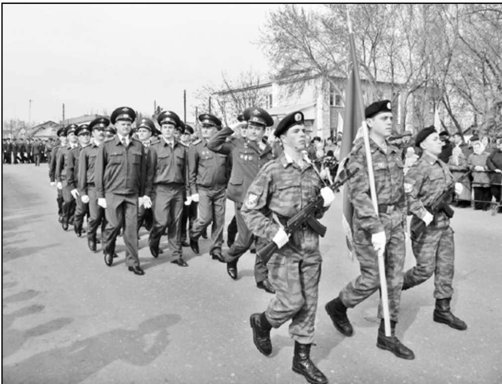
Парад с участием кадетов, сотрудников пограничной службы и полиции. 2008 год