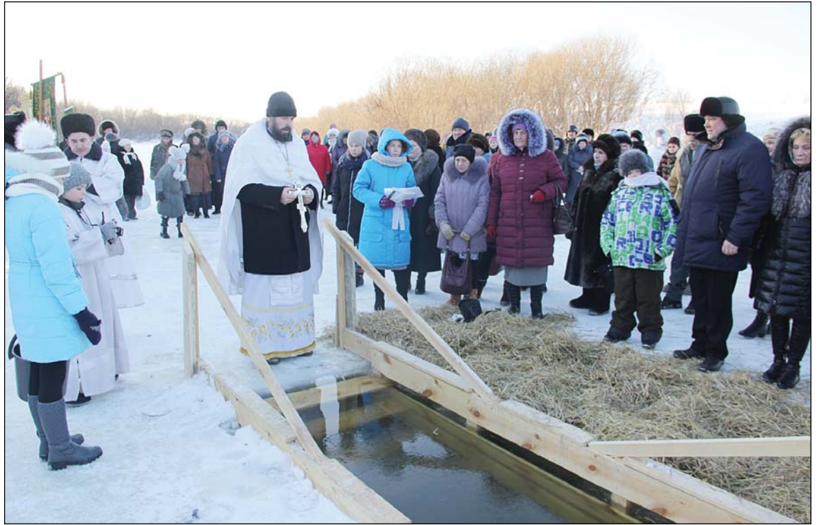
• Молитва перед освящением воды в крещенской купели.