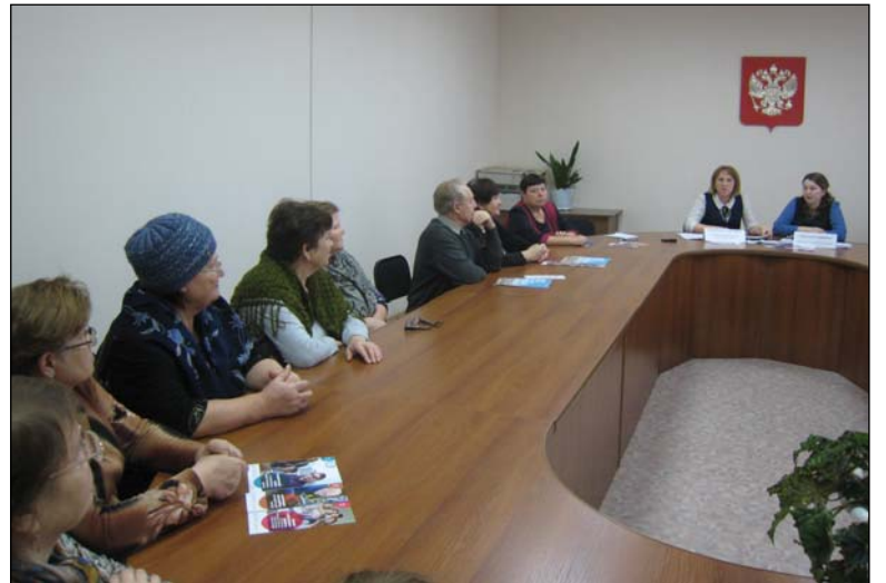
• Участники беседы внимательно слушали специалистов клиентской службы ПФР в Аромашевском районе об изменениях в пенсионной системе.

– Для установления повышения необходимо соблюдение следующих условий: отсутствие трудовой деятельности в настоящее время и наличие не менее 30 лет стажа в сельском хозяйстве: растениеводстве, животноводстве и рыболовстве. Опять же не все должности в совхозе подпадают. Бухгалтер, экономист, кадровик не получат надбавку, даже если они в совхозе работали. Мы поднимали личные дела всех пенсионеров района и заносили сельский стаж. Проанализировали, оказалось, что в животноводстве меньше профессий подходит под данное постановление.