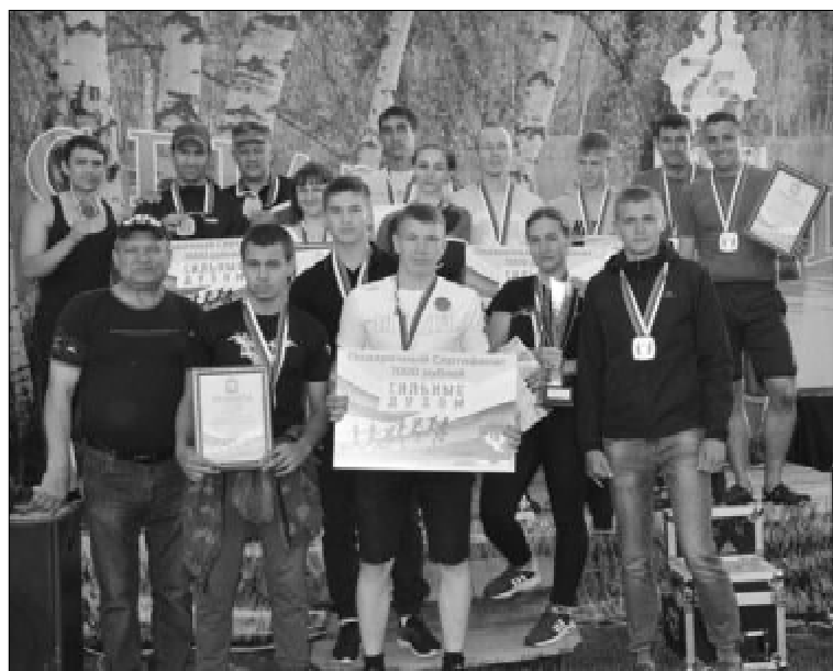
Победители и призеры забега

Благодаря поддержке и содействию неравнодушных людей района, и непосредственно коллективу Физкультурно-оздоровительного центра, воплотившему идею в жизнь, более шестидесяти отчаянных смельчаков из Калмакского, Южно-Дубровного, Капралихи, Иваново, Прохорова, Орлово, Армизонского (районной больницы, ЖКХ, школы) смогли испытать себя в экстремальных условиях и узнать, кто на что способен. Комплект «бронзовых» медалей и денежный приз завоевала команда «Экстрим» (администрация Армизонского района), обладатель «серебра» и материального поощрения - «Гранит» (футболисты), а выс-