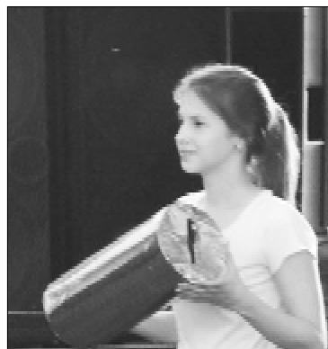
Новую «капсулу времени» скоро передадут в архив