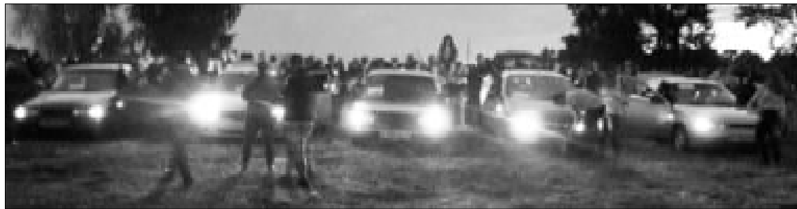
Участники автозвука в строю

Общая «картина» получилась классная, почти, как в кино про стритрейсеров.