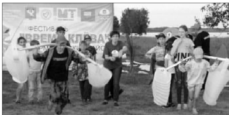
Эх, нелегкая ноша!