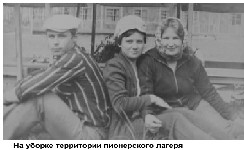
На уборке территории пионерского лагеря