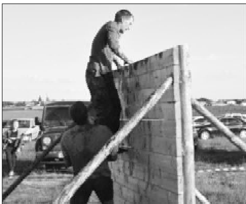
Смелость «города» берет