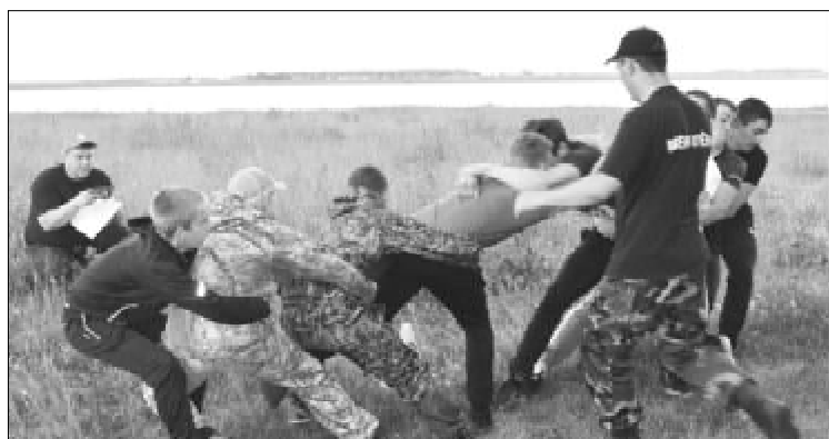
Ещё немного, ещё чуть-чуть...

У участников соревнований (от 16 до 25 лет) была возможность доказать, что не перевелись ещё в нашем районе богатыри. Молодцы-удальцы с лёгкостью переносили деревянные «срубы», на время приседали с ведрами на коромысле, наполненными песком, шли «стенка на стенку»... А какое мастерство демонстрировали в боях на поясах, в том числе и на одной ноге! Все показали себя на высоте, но всё же победителем турнира стала команда «Рама» из Армизона. Поздравляем!