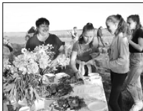
Угощение жителей улицы Спортивная

В общем, в этот вечерний День молодёжи никто голодным не остался - кухня была и платная, и бесплатная.