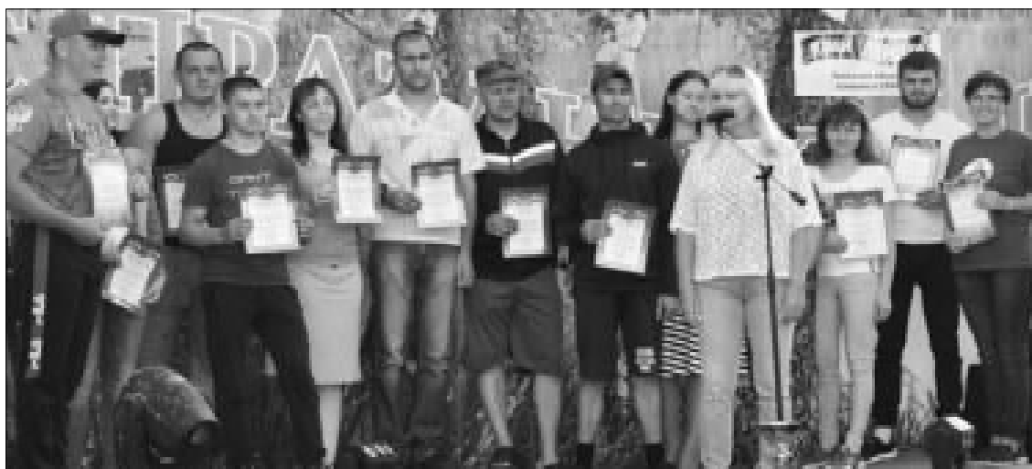
Самые креативные и позитивные

Она также поздравила с праздником армизонцев и гостей, пожелала здоровья, ведь когда человек здоров — он счастлив.