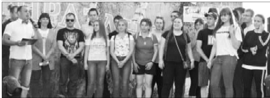
Команды автоквеста перед стартом