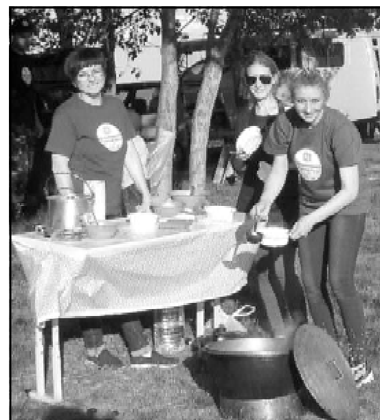
Педагоги Дома творчества приготовили уху

Материалы полос подготовили Галина СИЗИКОВА и Лариса ЛАПУХИНА (Продолжение на 6 стр.)