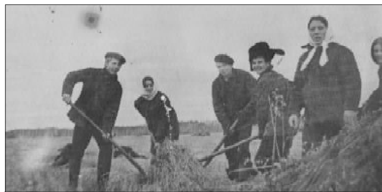
Комсомольцы помогают заготавливать сено