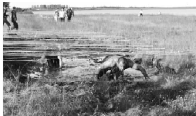
Экстремалам всё нипочём