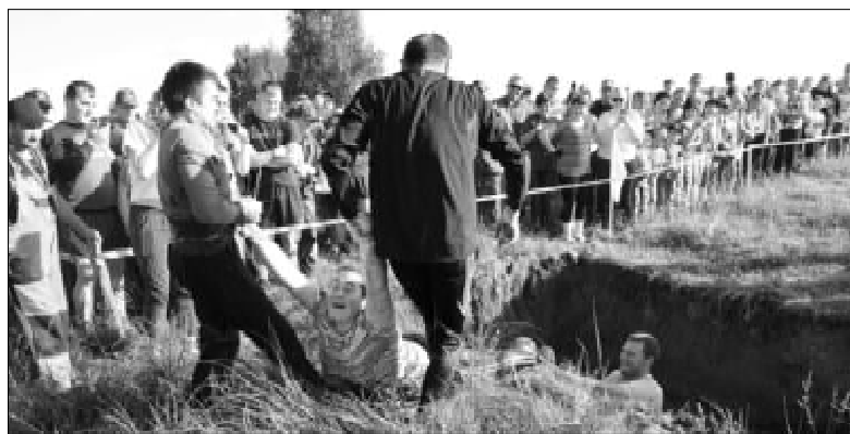
Один - за всех и все - за одного

остались и остальные участники, которые были отмечены грамотами. Потому что все они - просто МОЛОДЦЫ!