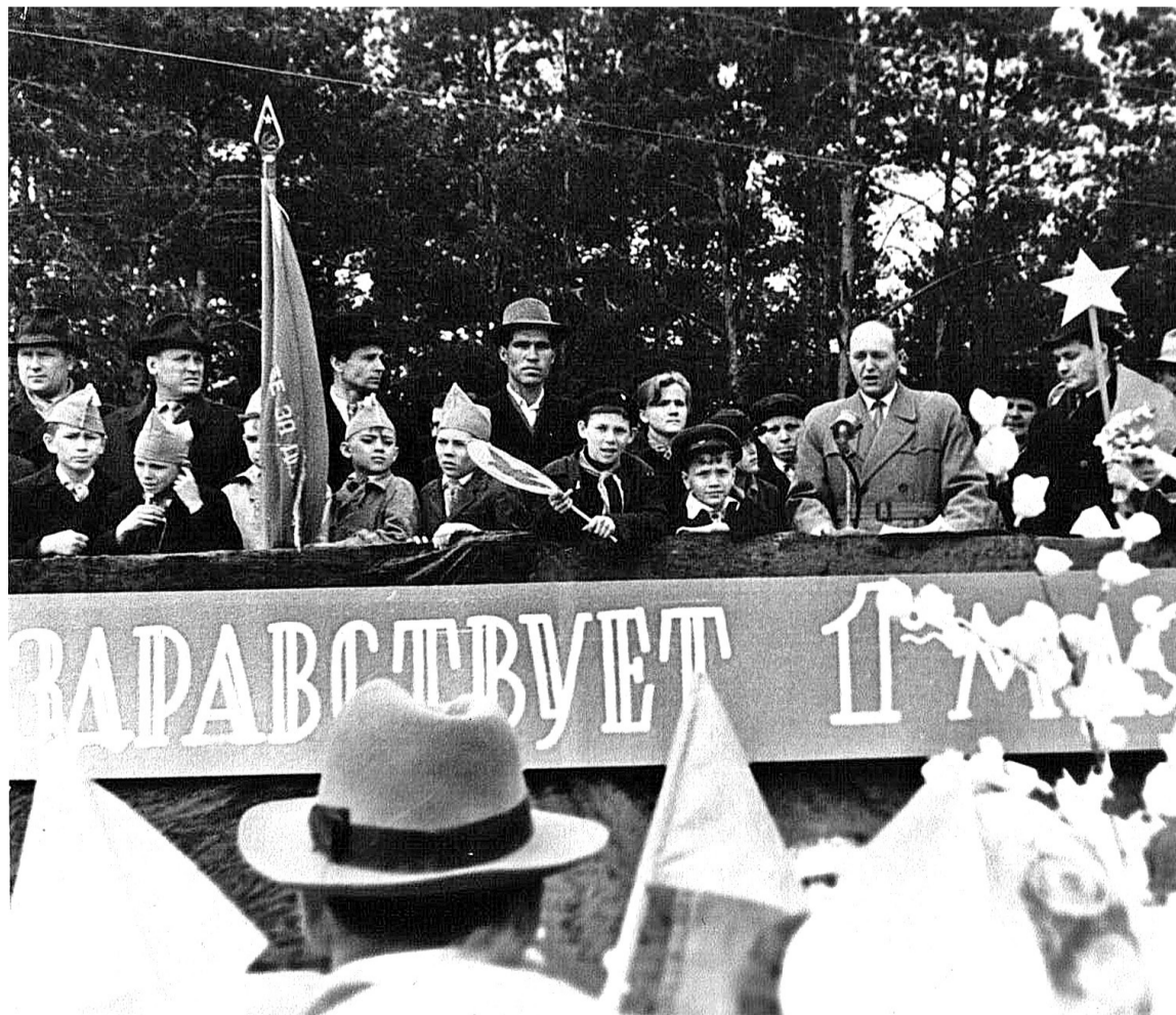
• Первомайский митинг 1960 года в Заводоуковске проходил на площади перед элеватором.

В Заводоуковском краеведческом музее хранится уникальная фотография: на митинге 1 мая 1960 года землякам сообщают о присвоении Заводоуковску статуса города.