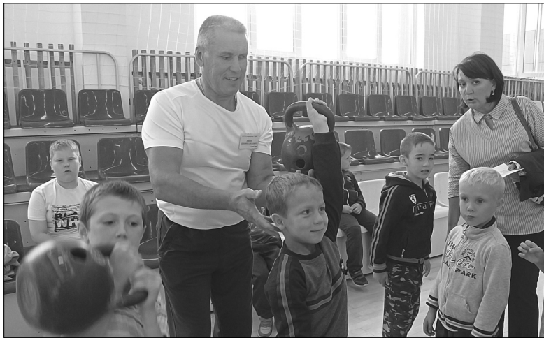
Мальчишки с интересом тягали гири – проверяли силу

Показательным шоу успешных юных баскетболистов стартовал День открытых дверей в Голышмановской спортивной школе олимпийского резерва. Гости встречали на стадионе «Центральный» 14 сентября. Мероприятие проходило в форме путешествия по станциям, где организаторы знакомили родителей и детей с деятельностью учреждения, направлениями его работы, традициями. Словом, помогли определиться со спортивной секцией.