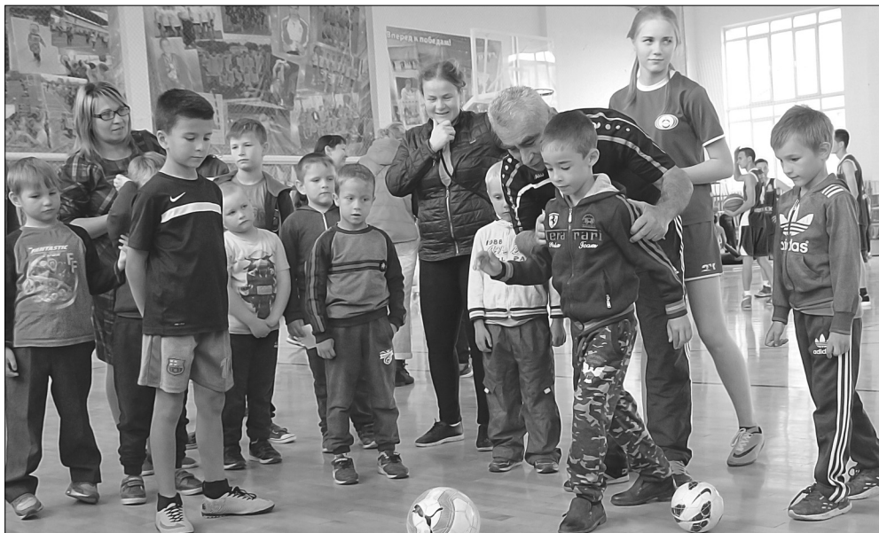
Было много желающих забить гол