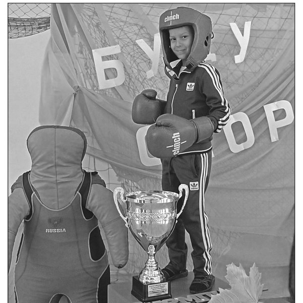
Почувствуй себя чемпионом!