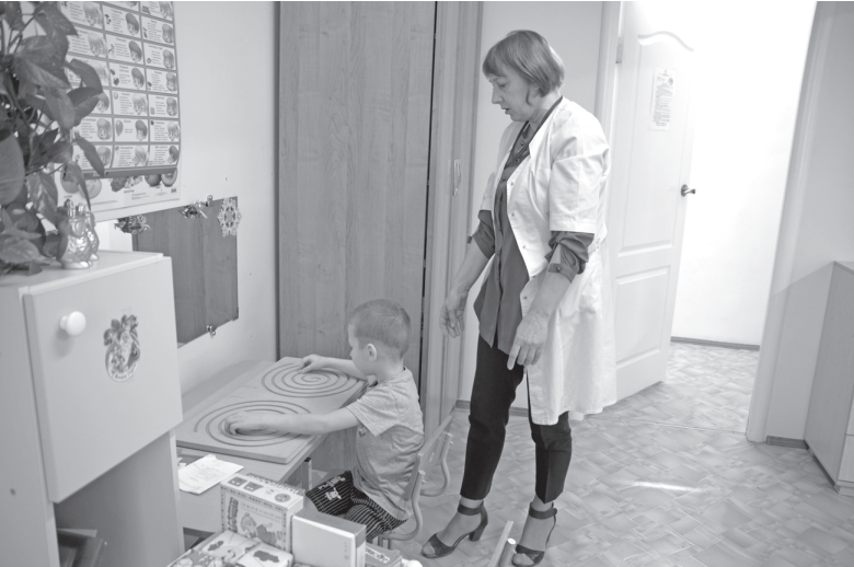
Дети быстро осваивают межполушарные тренажёры

В рамках реализации проекта «Мир для тебя» было закуплено оборудование и была проведена учёба в Московском центре специалистов (двух психологов и дефектолога) для лечения детей с аутизмом. Стоимость проекта составила около полутора миллионов рублей. «Мы очень благодарны компании СИБУР за их «Формулу хороших дел». Благодаря выигранным грантам мы получаем необходимое для лечения и реабилитации наших юных пациентов необходимое оборудование и видим эффект от его применения. Если говорить о третьем проекте, то он весьма актуален. Пациентов с аутизмом становится всё больше. Это обще-