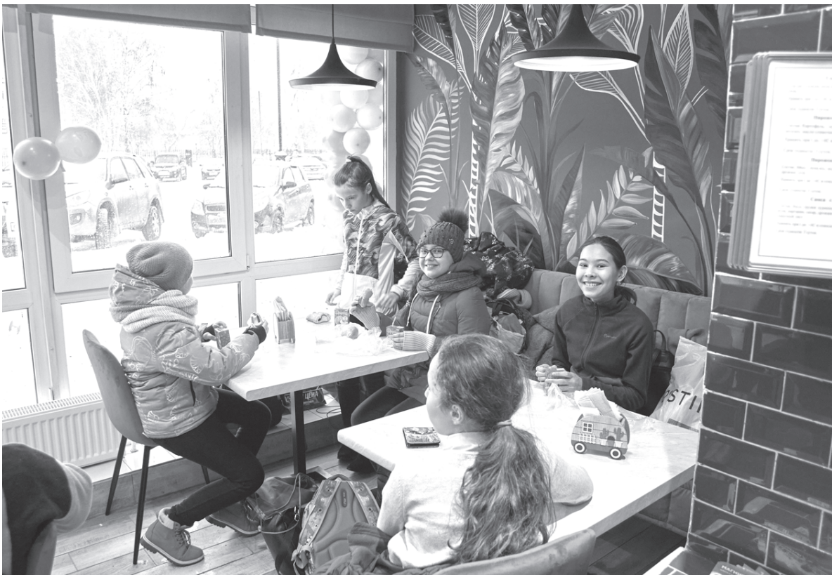
Гости от мала до велика в восторге от новой пекарни-кондитерской

дукции выпекается здесь же на месте и сразу выставляется на прилавок. – Но это первый мой проект, где посетители могут не только купить свежееиспечённый хлеб и хлебобулочные изделия, но и уютно посидеть, отдохнуть и провести время с друзьями за чашечкой чая или кофе. Или просто гуляешь по любимому городу, и как приятно, особенно зимой, зайти погреться в нашу кондитерскую. Уже есть постоянные посетители, кто приходит пораньше и ждёт горячего хлеба, – поделился во время от-