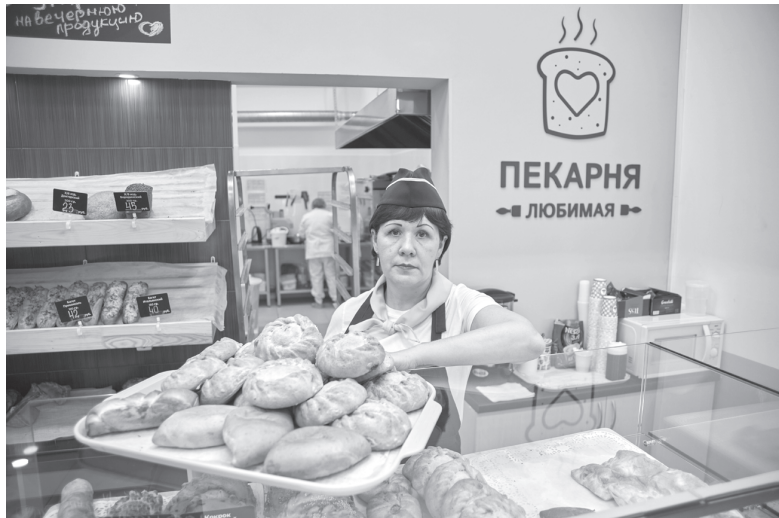
Удмуртская выпечка пришлась по вкусу сибирякам

И в «Любимой пекарне» готовится и продаётся горячий хлеб, вкусная выпечка, приготовленная вручную по домашним рецептам. «Наши рецептуры предоставляют широкий выбор любой аудитории потребителя.