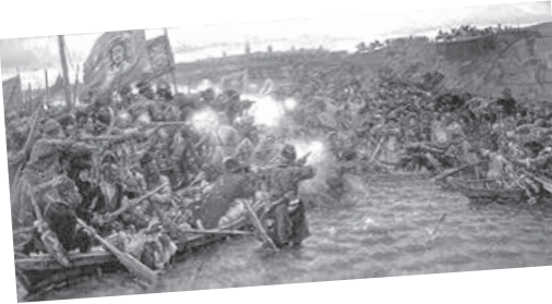
Самаровская, 17, «Тобольская правда».

То есть в этом году – 125 лет со дня этого события. В честь такой даты мы объявляем конкурс среди юных тоболяков на лучший рисунок того уголка Тобольска, какой наиболее близок конкурсанту. «Мой Тобольск» – это про свою подгору, свою Красную площадь, свой кремль, свой сквер имени «Тобольской правды». Рисунки принимаются в течение февраля.