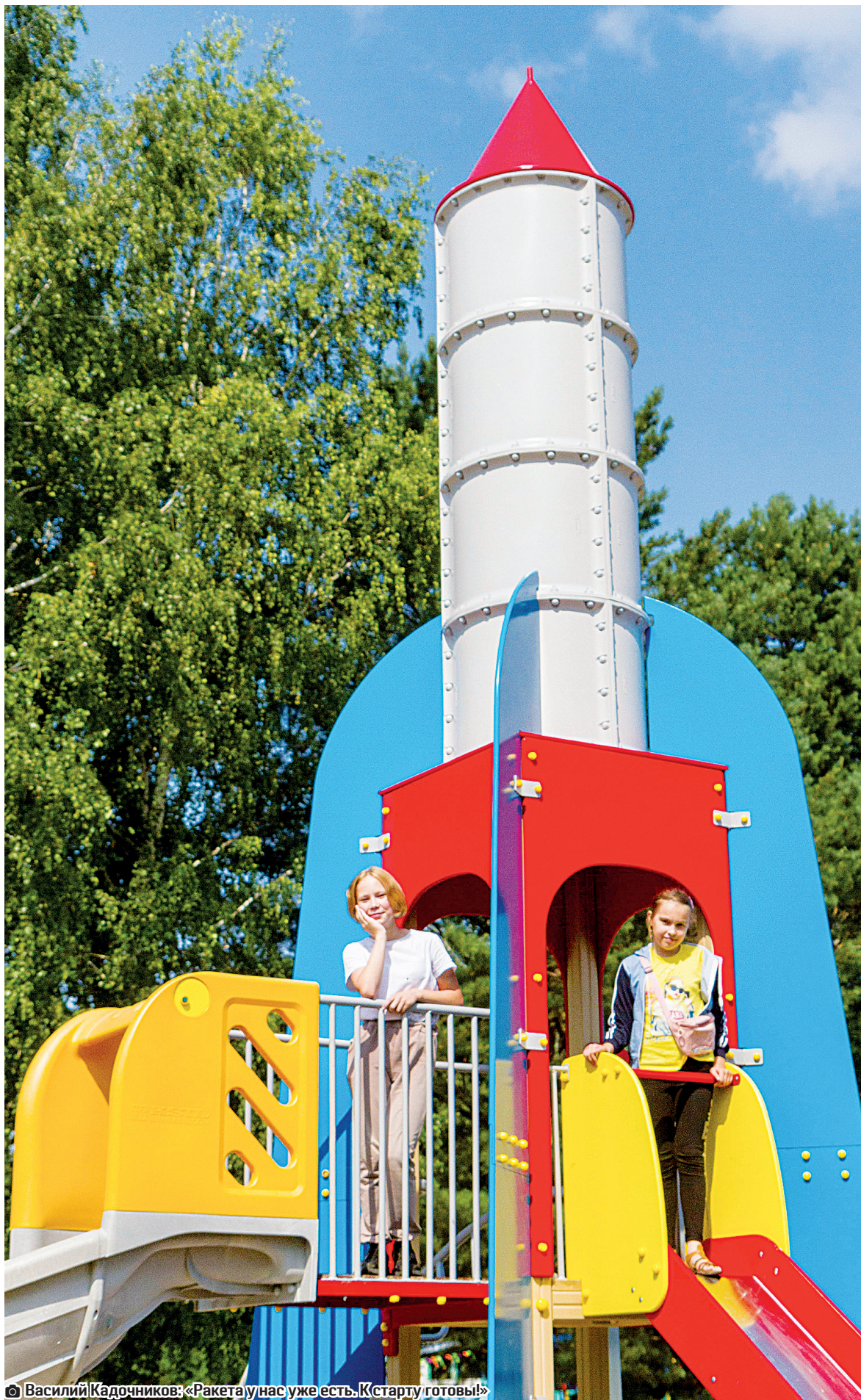
© Василий Кадочников: «Ракета у нас уже есть. К старту готовы!»