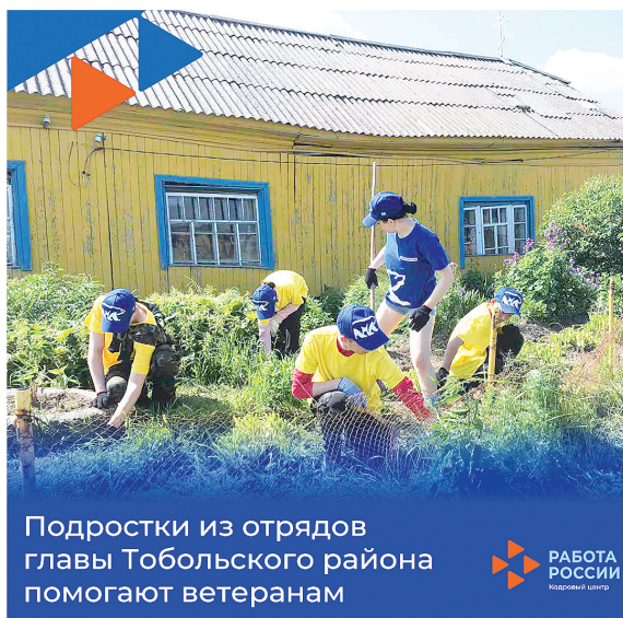
Подростки из отрядов главы Тобольского района помогают ветеранам