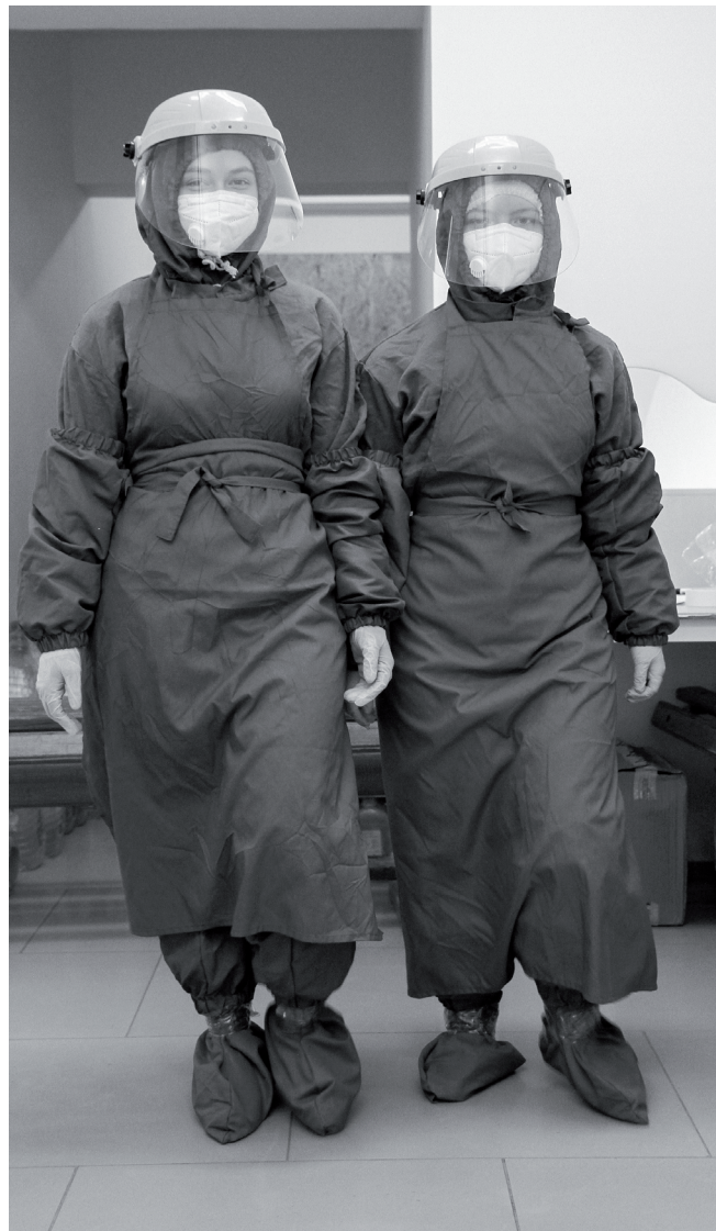
В красной зоне работают в защитных костюмах: поверх нательного белья надеваются комбинезон, фартук, бахилы, нарукавники, перчатки, маска, щиток. «Жарковато, но привыкли», – признаются сотрудники моногоспиталя.