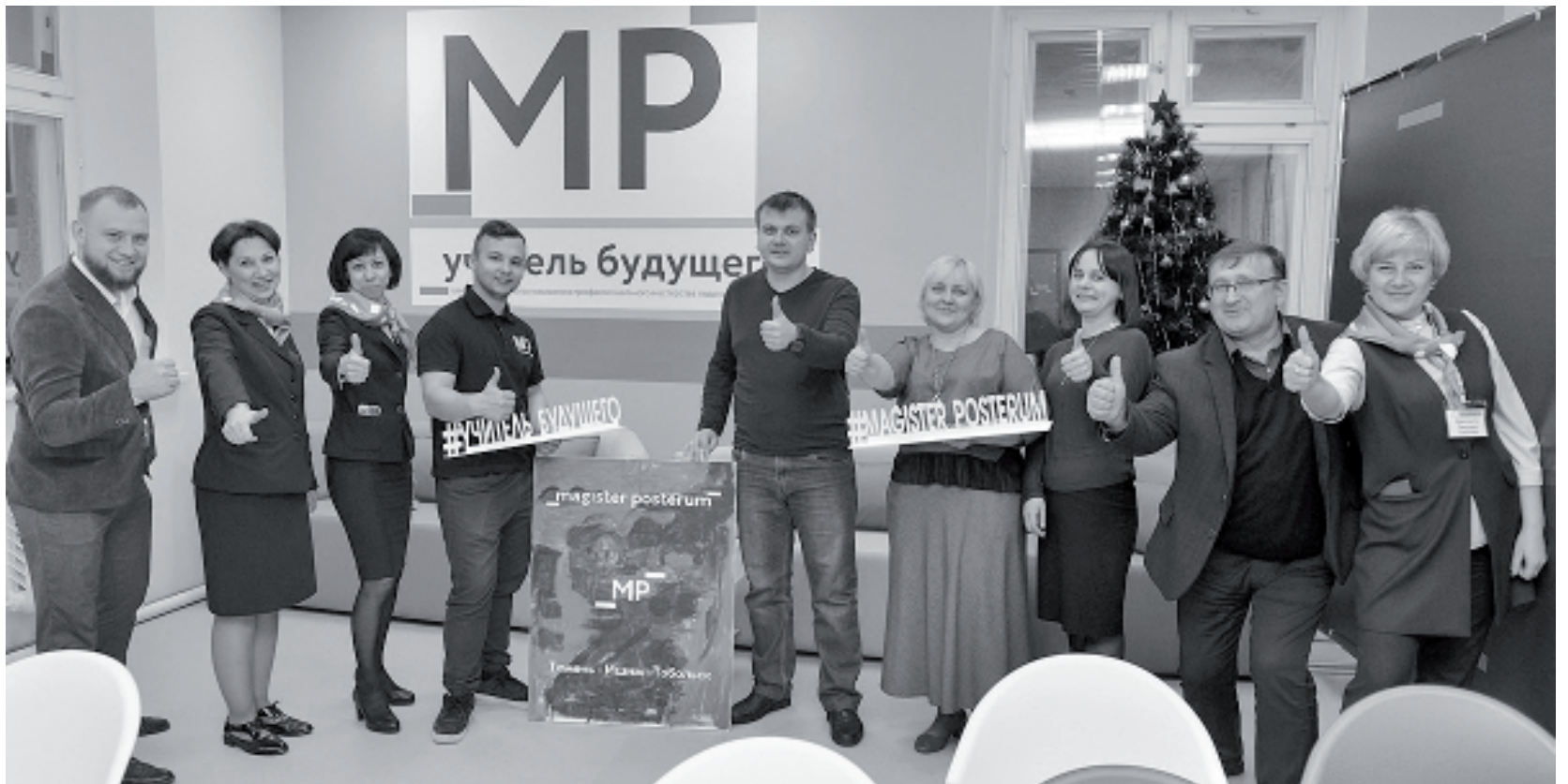
Ярко и незабываемо прошло 19 декабря 2019 года открытие центра непрерывного повышения профессионального мастерства педагогических работников в Ишиме, задав тон и атмосферу творчества и живого общения на весь год.

— Главная задача центра — помочь педагогам спланировать и реализовать индивидуальные образовательные маршруты развития, — продолжает Оксана Васильевна. — За год диагностику уровня профессиональных компетенций прошли 645 человек. 203 педагогам Ишимского образовательного округа ока-