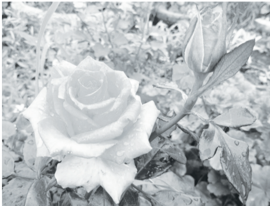
Розам нравится осенняя пора.