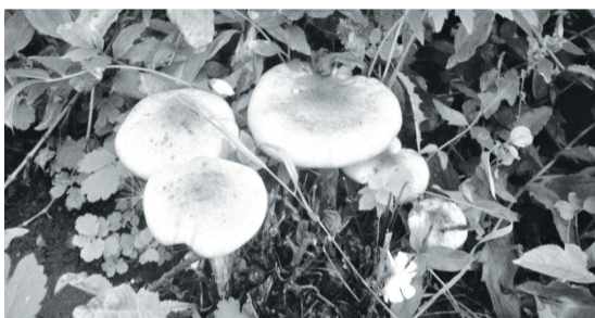
В палисаднике выросли опята.