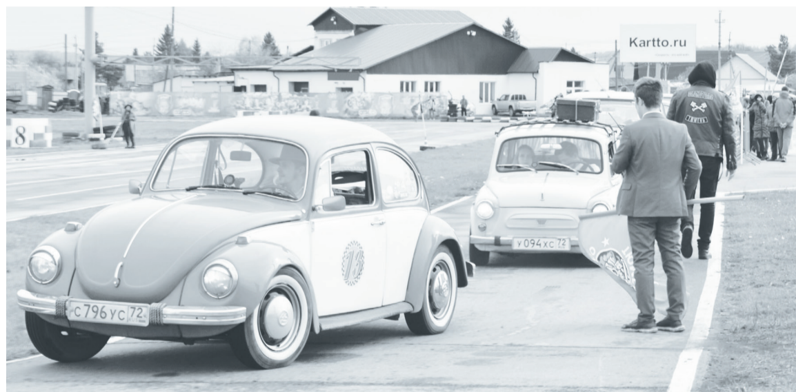
Volkswagen Käfer 1972 г.в. – самый популярный автомобиль мероприятия.