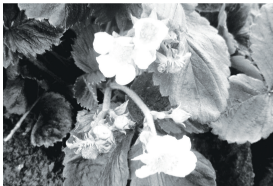
Неожиданно в октябре повторно зацвела садовая клубника.