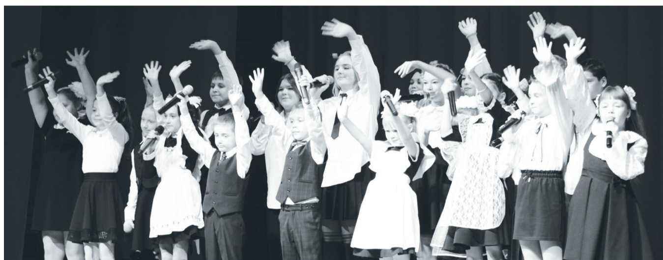
Праздник начался с выступления юных артистов Упоровской детской школы искусств.