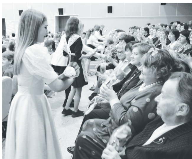
Ветеранам педагогики учащиеся подарили цветы.