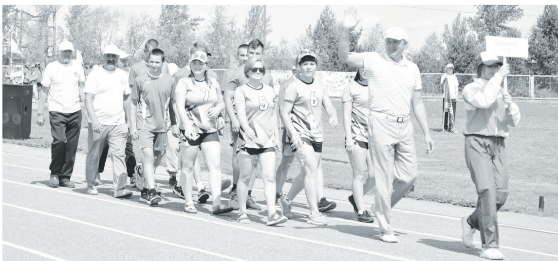
Бызовские спортсмены на параде в честь открытия юбилейных районных сельских игр.

По заказу Бызовской администрации подготовила Регина ГАПОНОВА.