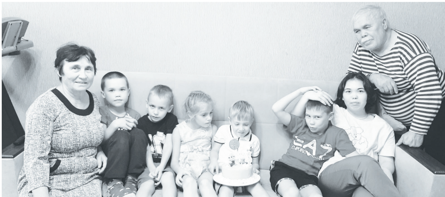
Многочисленное семейство Сарамовых на дне рождения Корнея – самого младшего внука.

Марина МЕДВЕДЕВА. Фото из архива САРАМОВЫХ.