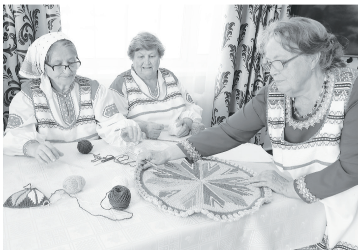
Рукодельницы из масальского клуба «Серебряная нить» готовят для выставки коврики с национальным орнаментом.