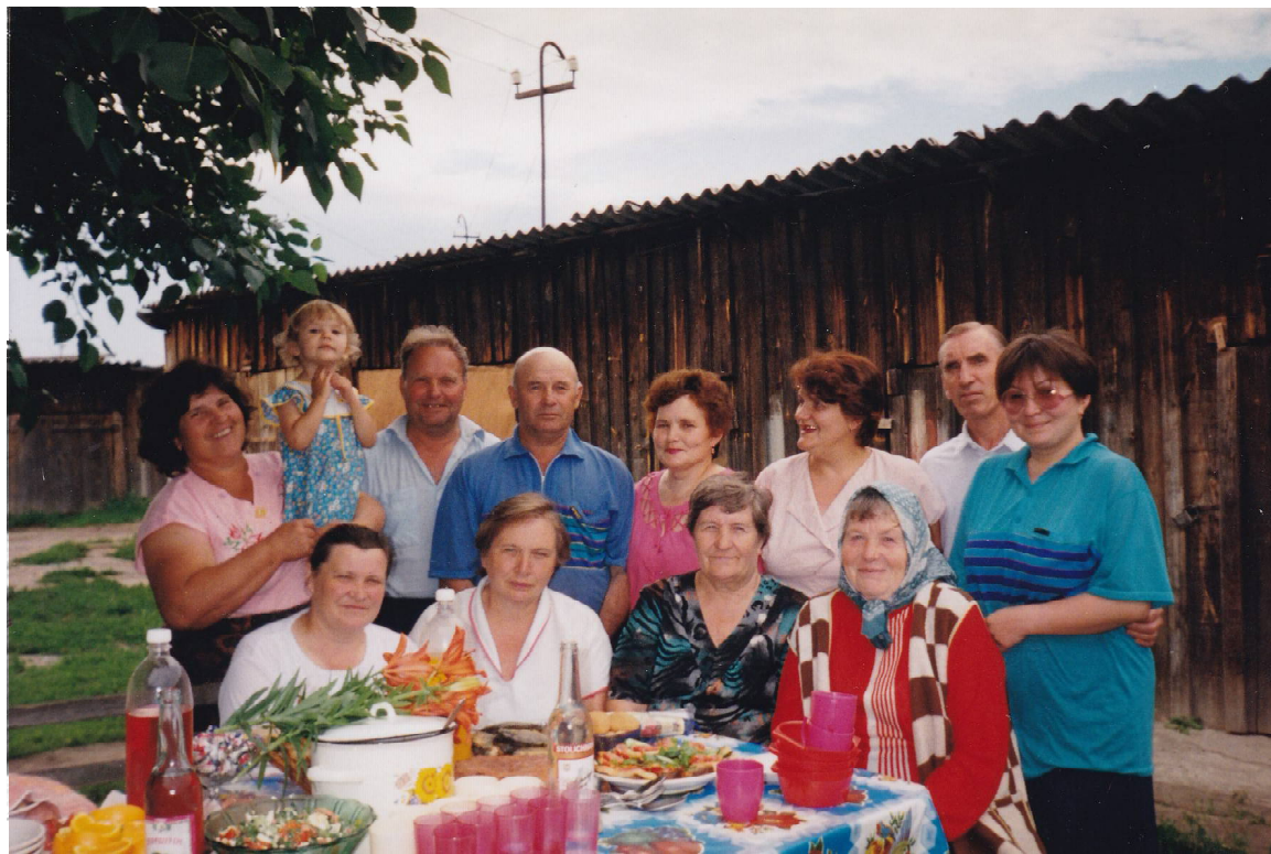
➤ А вы узнали людей и что за дом на этом снимке?

Хорошие соседи — это большая удача. Недаром в старину говорили: «Выбирая место для строительства дома, выбирай соседа». Соседи — часть нашего бытия, и если повезёт, и они окажутся хорошими людьми, с которыми были прожиты десятки лет, то они навсегда останутся почти что родственниками: и на помощь придут в трудную минуту, и за домом присмотрят, и за детьми, если понадобится. А когда у мужчин-соседей есть общие интересы — рыбалка, охота, увлечение техникой, — то считай, что они уже братья. Если же соседка ещё и мудрая женщина, подскажет, как сохранить в семье на долгие годы порядок, мир, согласие и уважение друг к другу, то это уже больше чем сестра, и это дорогого стоит. Такими соседями грех не гордиться!