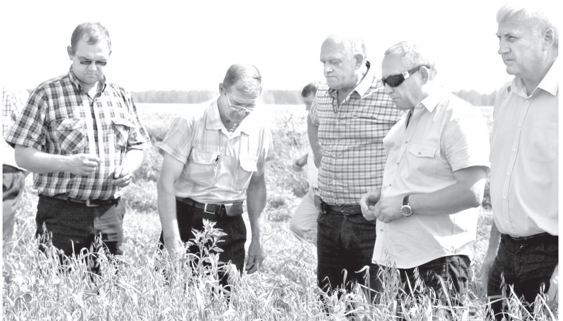
• «Скоро дозреет урожай и на полях Мичуринской свиноводческой компании» – такой вердикт вынесли собравшиеся на дне поля.