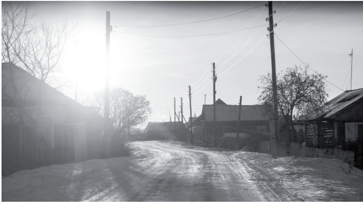
Зимний день в селе Второе Песьяново.