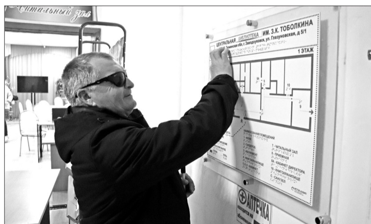
Планы эвакуации нужны не только на случай беды. Незрячему человеку такие таблички с выпуклыми изображениями и подписями шрифтом Брайля помогают освоиться в незнакомом помещении.

Горожанин замечает, что для передвижения незрячего че-